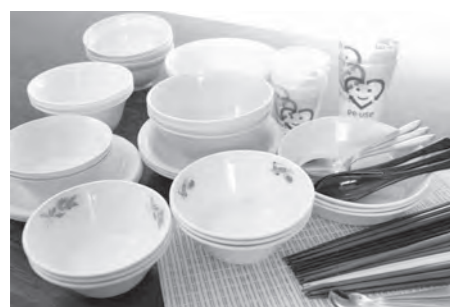
皿・おわん・コップ・箸など、提供品目に合わせて食器を選べます