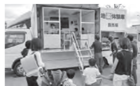
▶前回の地震体験の様子

8月30日(水)から9月5日(火)までの「防災週間」に合わせて、安心安全フェアを開催します。災害に対する備えと心構えを確認して防災への意識を高めましょう。 期日 9月1日(金) 時間 午前10時〜午後4時 会場 伊勢崎駅前インフォメーションセンター、伊勢崎駅南口駅前広場 ※車で来場の際は、ベイシアスーパーマーケット伊勢崎駅前店の駐車場を利用してください 内容 ●地震体験、水消火器体験 ●緊急車両などの展示 ●木造住宅の耐震相談 ●防災用品・非常食の展示 ●防犯啓発チラシ配布など ※内容は変更する場合があります 問い合わせ 安心安全課 ☎(27)2706