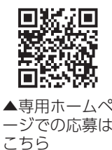
▲専用ホームページでの応募はこちら

パネル展示などで健康情報を見てクイズに回答した人の中から、抽選で150人に記念品を差し上げます。 対象 市内に在住の18歳以上の人 応募方法 次のいずれかの方法で応募してください ●応募用紙に回答を記入の上、回収箱に入れる ●応募用紙や回収箱は各保健センターにあります ●専用ホームページ(https://logoforn.jp/form/Gpftu/8833)から応募する 締切日 11月10日(金)