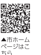
▲市ホームページはこちら

令和6年4月に小学校に入学する子ども(平成29年4月2日から平成30年4月1日生まれ)の健康診断を、9月下旬から11月上旬にかけて各小学校で行います。保護者の皆さんは、該当する子どもに必ず健康診断を受けさせてください。 対象の子どもがいる世帯には、健康診断の通知を9月中旬に郵送します。通知が届かない場合や次の事項に該当する場合は、学務課に問い合わせください。 ●当日、病気などで欠席する場合 ●健康診断の受診に当たり事前に配慮を希望する場合 ●外国人で、日本の学校への入学を希望しない場合 ※日程は市ホームページで最新情報を確認してください 問い合わせ 学務課(☎272787)