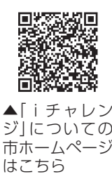
▲「イチチャレンジ」についての市ホームページはこちら

今回は「糖質制限」などの言葉で目にすることの多い「糖質」をテーマにパネル展示などを行います。 期間 10月31日(火)まで 【パネル展示】 会場 健康管理センター、赤堀保健福祉センター、あずま保健センター、境保健センター ※土・日・祝日は除きます 【市ホームページでの情報発信】 スマートフォンなどで左記の二次元コードを読み取るか、市ホームページにアクセスして閲覧できます。