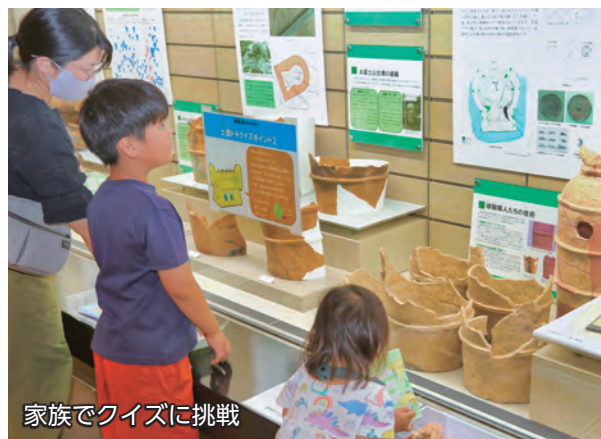
家族でクイズに挑戦