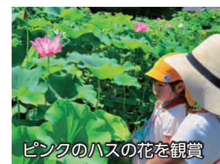
ピンクのハスの花を觀賞

8月3日、天幕城趾あかぼり蓮園のハスの花が見頃を迎えていました。好天に恵まれたこの日は、ハスの花が咲く早朝から多くの人が見物に訪れました。来場者は、辺り一面に咲き誇った白やピンクのハスの花を觀賞したり、写真を撮ったりして、見頃を迎えたハスを楽しんでいました。