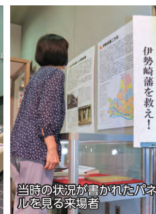
当時の状況が書かれたパネルを見る来場者

6月16日から8月27日まで、赤堀歴史民俗資料館で企画展「伊勢崎藩を救え！ 天明3年浅間山大噴火」が開催されました。会場には、240年前に発生した浅間山の大噴火に関するさまざまな資料を展示。来場者は、展示されたパネルや絵図、古文書などを観察し、危機に直面した当時の人々の姿に迫りました。