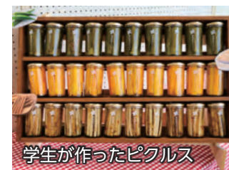
学生が作ったピクルス

7月31日、市役所東館1階市民ホールで「伊勢崎産農産物の販売」が行われました。会場では、伊勢崎商業高校と伊勢崎興陽高校の生徒が生鮮野菜や市内産農産物を使用した加工品などを販売。生徒たちは予想以上の売れ行きに驚きながらも、時間をかけて作った野菜や加工品を自分たちの手で販売することに喜びを感じていました。