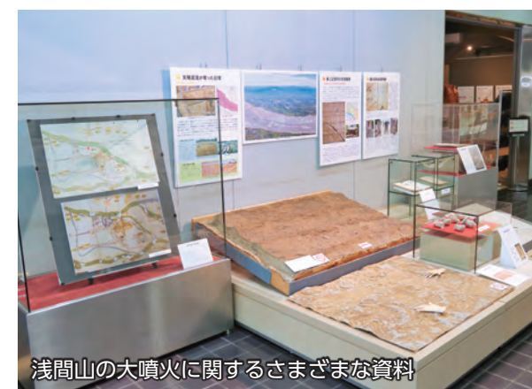
浅間山の大噴火に関するさまざまな資料