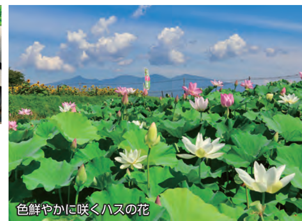
色鮮やかに咲くハスの花