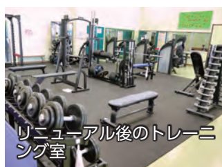
リニューアル後のトレーニング室

8月2日、アイオーしんきん伊勢崎アリーナ(市民体育館)のトレーニング室がリニューアルオープンしました。ステアクライマー、エリプティカル、スミスマシンなどの器具を新たに導入したほか、既存器具も更新。14日には、多くの人々がトレーニング室を訪れ、新しい器具を使い真剣にトレーニングをしていました。