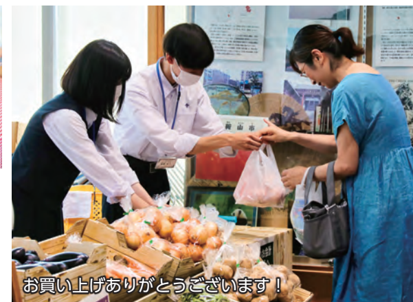
お買い上げありがとうございます！