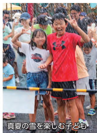
真夏の雪を楽しむ子ども

8月11日から15日まで、Akaoka Mirai 華蔵寺遊園地(華蔵寺公園遊園地)で「真夏に雪を降らせまショー」が開催されました。14日にはイベントを楽しみに多くの人々が来場。遊園地には大粒の雪が降り注ぎ、参加者は季節外れの雪を目いっぱい楽しみました。