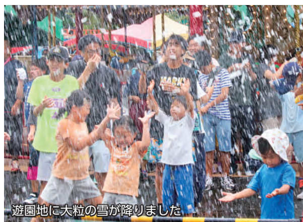
遊園地に大粒の雪が降りました