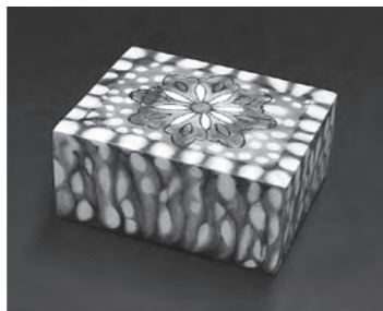
▲多田山の唐三彩陶枕レプリカ

多田山の唐三彩と古代佐田の関わり 殖蓮公民館(☎26-4560) 多田山から出土した唐三彩を通して、平城京と古代伊勢崎の深い関わりについて詳しく明かす講座です。 期日 10月25日(水) 時間 午後1時30分～3時10分 会場 殖蓮公民館 対象 市内に在住または在勤・在学の人 定員 12人(先着順) 内容 クラフトバンドを使い小物入れを作ります 参加料 700円(材料費) 申し込み 10月10日(火)午前9時から電話で清掃リサイクルセンター21へ