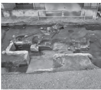
▲れんがで造られた染色用のかまど跡

歴史文化講座を開催します 企画展の開催に合わせて、発掘調査で明らかとなった遺跡について、発掘調査担当者による講座を開催します。