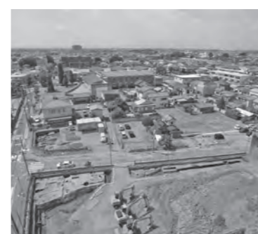
▲発掘調査中の伊勢崎城跡

狂犬病予防注射(秋期) 犬の飼い主には、年1回、飼い犬に狂犬病予防注射を受けさせることが法律で義務付けられています。本年度、まだ予防注射を済ませていない飼い主は、必ず受けさせましょう。 問い合わせ 環境政策課 ☎(27)2733 登録済みで注射が済んでいない犬の飼い主には、「狂犬病予防注射のお知らせ」のながきを郵送しますので、当日会場に持ってきてください。登録が済んでいない犬の飼い主は、この機会に登録と注射を同時に済ませましょう。 ※注射の際に犬をしつかり押さえられる人が来場してください ※会場を汚さないよう、犬のふんは飼い主が責任をもって持ち帰りましょう 期日・会場・時間 左表のとおり ※荒天などで中止する場合があります 対象 生後9日以降の犬 ※健康でない犬は、近くの獣医師に相談してください 料金 1頭につき3500円 ※未登録の犬は登録料3000円が別途かかります