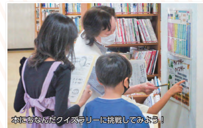
本にちなんだクイズラリーに挑戦してみよう!