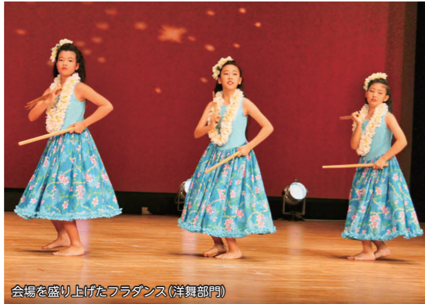
会場を盛り上げたフラダンス(洋舞部門)