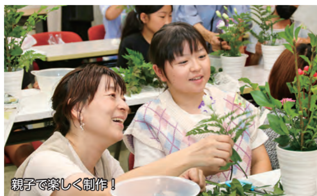
親子で楽しく制作！