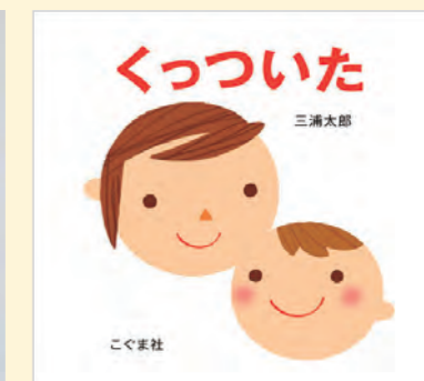
▲『くっついた』(こぐま社)