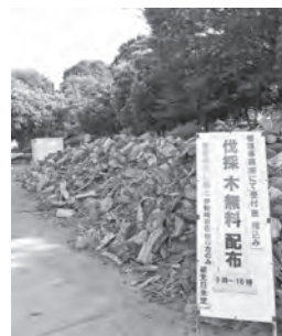
▲無料配布する伐採した樹木