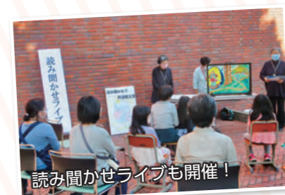
読み聞かせライブも開催!