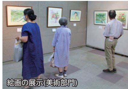
絵画の展示(美術部門)