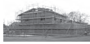
▲建設中の配水池の様子

申し込み・問い合わせ 10月25日(水)から電話で上下水道局総務課(☎30-1272)