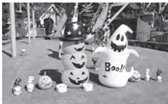
▲昨年のハロウィンの飾り

◆ 仮装している人はマジカルライダーが無料 ハロウィンの衣装で受け付けをするとマジカルライダーに無料で乗ることができます。 ※帽子や小物だけでは該当しません ◆ 踊りに参加するとお菓子をプレゼント 午後6時から、愉快なお化けたちとキャンプファイヤーを行います。踊りに参加した子どもには、お菓子を差し上げます。