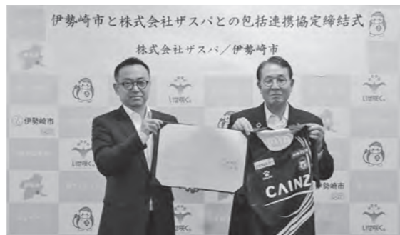
▲協定書を持つ株式会社ザスパの赤堀代表取締役社長と臂市長