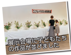
展示会場に子どもたちの作品が並びました

9月9日、ベイスシアIS伊勢崎店(中央町)で「こどもいけばな体験教室」が行われました。参加した子どもたちは、先生に教えてもらいながら真剣な表情で花材を生け、思い思いの生け花を制作。完成後は同日に開催されていた「いけばな展」の会場に作品を展示しました。展示後は、自分の作品を前に記念写真を撮ったり、友達の作品を鑑賞したりして楽しむ子どもたちの姿が見られました。