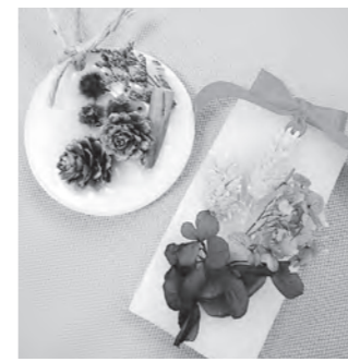
▲教室で作る作品例

期日 11月8日(水) 時間 午前10時～正午 会場 北公民館 対象 市内に在住または在勤の人 定員 10人(先着順) 内容 置くだけで香りが楽しめるアロマシエキヤンドルを2個作ります 参加料 800円(材料費) 申し込み 10月23日(月)午前9時から電話で北公民館へ