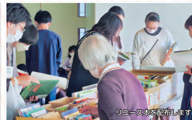
リユース本を配布します