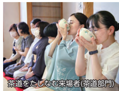
茶道をたしなむ来場者(茶道部門)

9月3日、人材派遣ワイズコーポレーション境総合文化センターで「市文化協会第1期事業発表会」が開催されました。美術部門では、絵画・工芸品などの美術作品の展示、フラワーアレンジメントのワークショップが行われました。茶道部門では、伊勢崎茶道会表千家・裏千家・江戸千家による茶会が開かれ、来場者にお茶のたて方、歩き方などの作法を実演。洋舞部門では、さまざまな団体がレクダンスやフラダンスなど、日頃の活動の成果を発表しました。