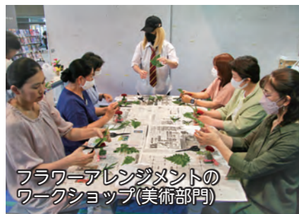
フラワーアレンジメントのワークショップ(美術部門)