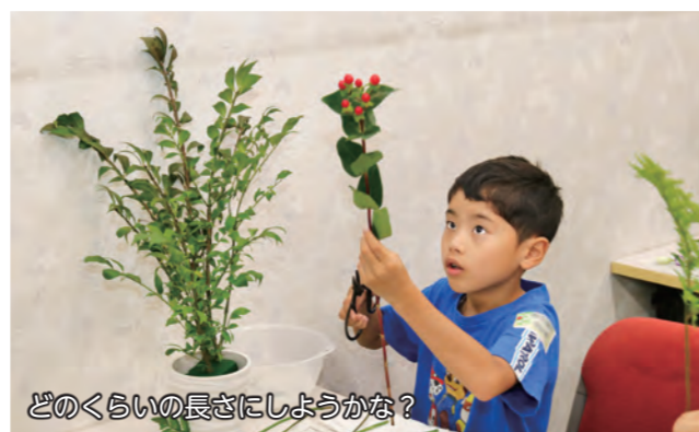
どのくらいの長さにしてもいいかな？

9月9日、ベイスシアIS伊勢崎店(中央町)で「こどもいけばな体験教室」が行われました。参加した子どもたちは、先生に教えてもらいながら真剣な表情で花材を生け、思い思いの生け花を制作。完成後は同日に開催されていた「いけばな展」の会場に作品を展示しました。展示後は、自分の作品を前に記念写真を撮ったり、友達の作品を鑑賞したりして楽しむ子どもたちの姿が見られました。