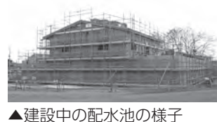
▲建設中の配水池の様子

申し込み・問い合わせ 10月25日(水)から電話で上下水道局総務課(☎30)1272)