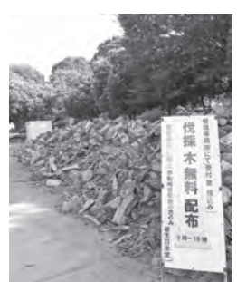
▲無料配布する伐採した樹木