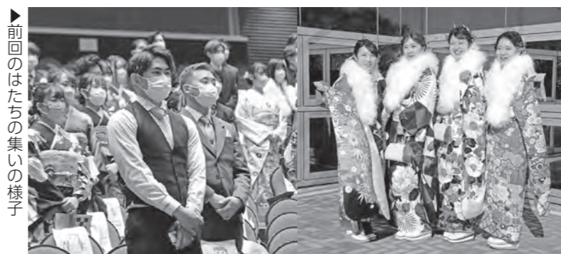
▶前回ははたちの集いの様子