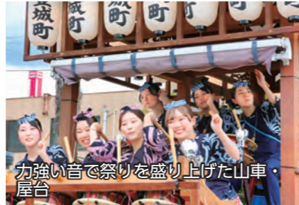
力強い音で祭りを盛り上げた山車・屋台