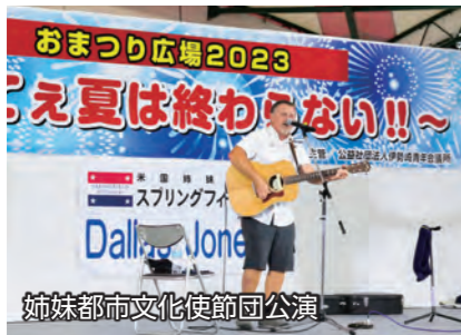
姉妹都市文化使節団公演