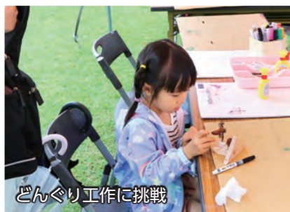
どんぐり工作に挑戦