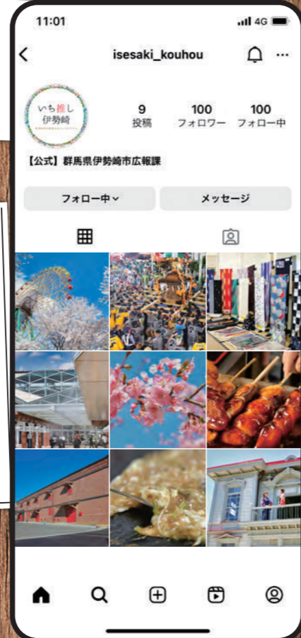
※写真はイメージです。公式Instagramに掲載している写真ではありません

11月中に公式Instagramで紹介した皆さんの「いち推し」の写真は、本紙や市ホームページに掲載します。さらに紹介をさせてもらった人には記念品も差し上げます。ぜひ投稿してください！