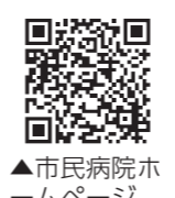
▲市民病院ホ ムページ