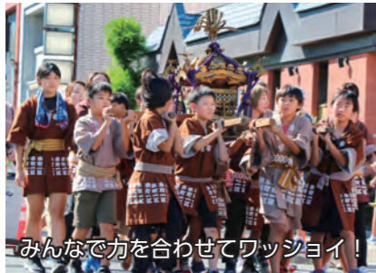
みんなで力を合わせてワッショイ!