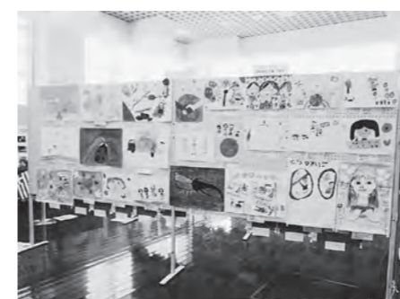
▲昨年の国際児童絵画展の様子

市内の小学生や国際姉妹都 市・国際友好都市の児童・生 徒の絵画作品を展示します。 期間 11月16日(木)から12月 1日(金)まで ※土・日・祝日は除きます ※12月1日(金)は午後2時ま で