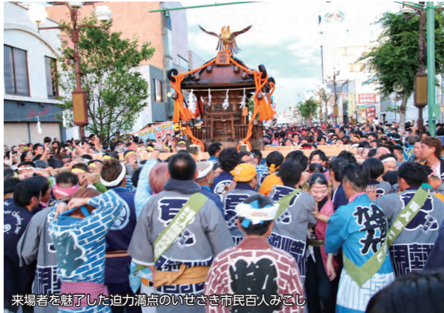
来場者を魅了した迫力満点のいせさき市民百人みこし

9月23日・24日に本町通りを中心に「いせさきまつり」が開催されました。2日間とも多くの人々が訪れる中、山車・屋台の巡行競演やみこしパレード、姉妹都市文化使節団公演などが行われ、祭りの最後には迫力満点のいせさき市民百人みこしが、来場者を魅了しました。