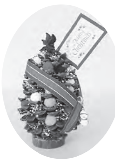
▲クリスマスツリーの 作品例

期日 11月20日(月) 時間 午前10時～正午 会場 清掃リサイクル センター21