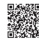
▲農業まつりの詳細はこちら