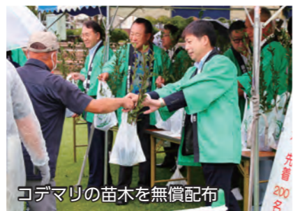
コデマリの苗木を無償配布