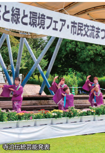
寺泊伝統芸能発表

10月1日、伊勢崎市みらい公園(いせさき市民のもり公園)で「花と緑と環境フェア」・「市民交流まつり」が開催されました。会場では、緑化に関するブースや環境団体・企業ブース、芸能発表など、緑化と環境への理解や地域との交流を深めるイベントが盛りだくさん。雨が降るあいにくの天気の中、訪れた人はステージイベントやブース展示などさまざまなイベントを楽しみました。