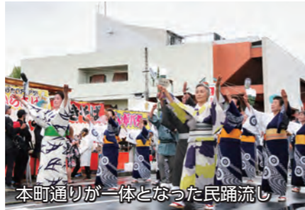
本町通りが一体となった民踊流し

9月23日・24日に本町通りを中心に「いせさきまつり」が開催されました。2日間とも多くの人々が訪れる中、山車・屋台の巡行競演やみこしパレード、姉妹都市文化使節団公演などが行われ、祭りの最後には迫力満点のいせさき市民百人みこしが、来場者を魅了しました。