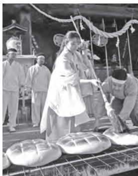
▲福饅神事・大串まんじゅう

伊勢崎神社では、一年の無病息災を願いまんじゅうを奉納する「福饅神事」を行います。年男・年女が願いを込めた直径約55センチの大きなまんじゅうに、観光特使ひまわりがみそだれを塗って炭火で焼き上げます。 時間 午後2時開始 会場 伊勢崎神社(本町)