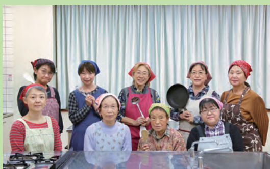
サークル名 美味しんぼ倶楽部

美味しんぼ倶楽部では、毎月の当番を決めてレシピの作成や材料の調達を行い、みんなで料理を作っています。地域のみなで料理をしようと集まったことをきっかけに発足し、ことしで26年目を迎えました。新型コロナウイルスの影響で活動できない期間もありましたが、今年度から活動を再開。会員同士の仲が良く、話し合いながら料理を作ったり、食事をしたりと、和気あいあいとした雰囲気の中で活動しています。