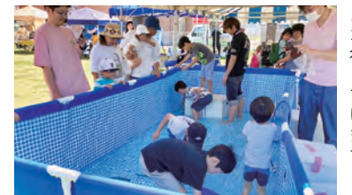
▲さまざまな催しなどを行っています