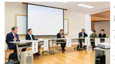
▲パネリストの皆さんと話し合いました