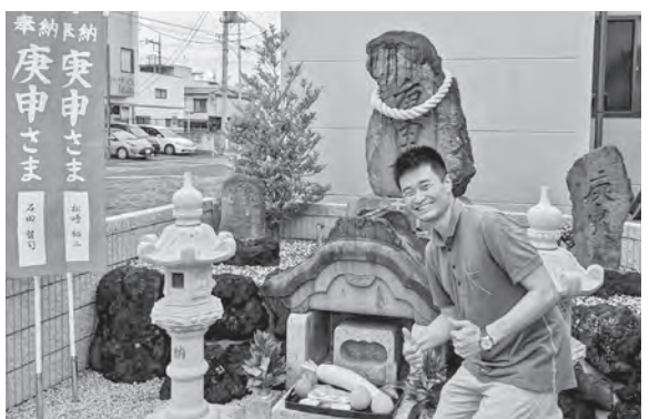
▲庚申講に参加した際の様子

このように、「地域を知りリスペクトを持ちながら外部の視点で活動する」ことを目指し、日々伊勢崎市の課題と向き合い活動を行っています。