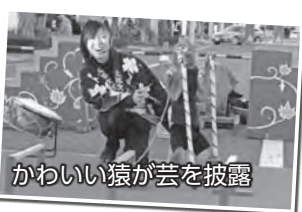
かわいい猿が芸を披露

【猿まわし】 時間 午後2時～6時30分 ※随時行います 会場 本町通りからくり時計前交差点付近 【新春みこし出初め】 時間 午後7時開始 会場 伊勢崎神社(本町) 【いせさき明治館新春銘仙展】 時間 午後1時～8時 会場 いせさき明治館