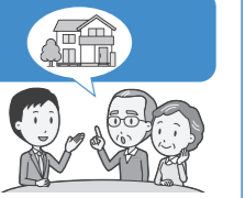
住宅に関するさまざまな相談に専門の相談員が応じます。