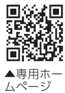
▲専用ホームページ

いせさき銘仙の端切れで飾る小箱ミニ絵本 三郷公民館(☎231952) 期日 3月16日(土) 時間 午後1時～4時 会場 三郷公民館 対象 市内に在住の5歳以上の子どもとその保護者 定員 8組(先着順) 内容 切り抜いた紙に銘仙を