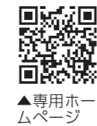
▲専用ホームページ

講座 市消防本部 会場 市内、玉村町内に在住または在勤・在学の中学生以上の人 対象 10人(抽選) 定員 成人に対する心肺蘇生法、AEDの使用方法などを学ぶ講習会です 参加料 無料 申し込み 2月1日(木)から13日(火)までの午前9時から午後5時までに電話で消防本部救急課または専用ホームページ(☎https://logofom.jp/form/Gpfu/450070)から申し込んでください