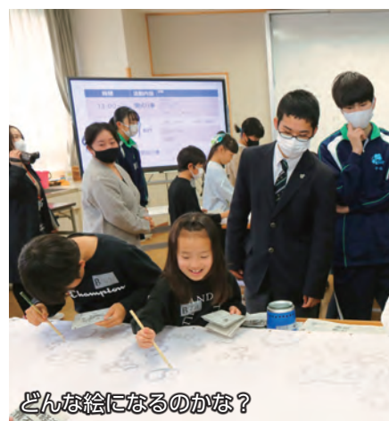
どんな絵になるのかな？