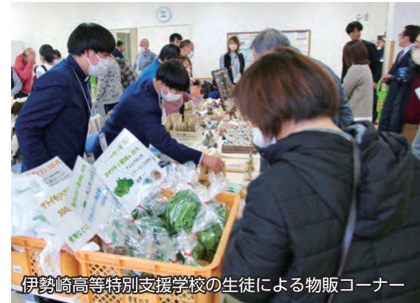
伊勢崎高等特別支援学校の生徒による物販コーナー