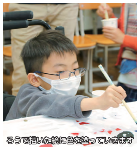
ろうで描いた絵に色を塗っていきます