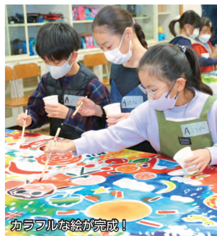
カラフルな絵が完成！