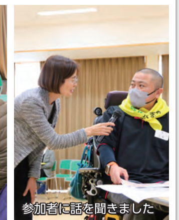
参加者に話を聞きました