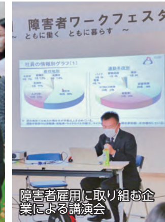
障害者雇用に取り組む企業による講演会

1月18日、伊勢崎市障害者センターで「障害者ワークフェスタ」が開催されました。会場では、障害者雇用の経験談を話す講演会や福祉事業所の利用者などによる物販コーナー、障害者の就労および福祉に関わる団体のパネル展示などが行われました。参加者は、講演会やパネル展示を通じて障害者雇用への理解を深めました。