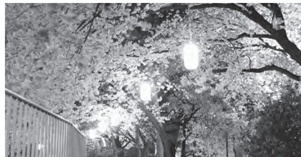
▲幻想的な夜桜が楽しめます

桜の開花時期は午後10時30分まで、桜の花の終了後は午後9時まで、園内をちょうちんでライトアップします。 期間 3月20日(祝)から5月12日(日)まで