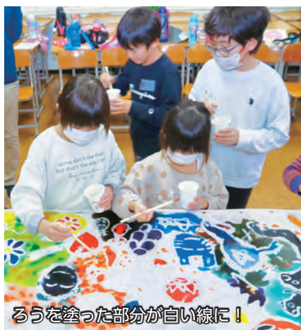
ろうを塗った部分が白い線に！