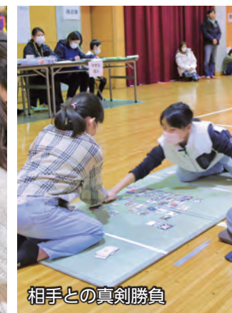
相手との真剣勝負

1月28日、ナルセグループ伊勢崎市民プラザで「市上毛かるた競技大会」が行われ、各地区の代表に選ばれた子どもたちが個人戦・団体戦に出場しました。真剣な表情でかるたの配置を覚える子どもたち。独特の緊張感が漂う会場では、札を読む声が響くと、威勢のいい声を上げながらお互いに札を取り合う、白熱した真剣勝負が繰り広げられました。