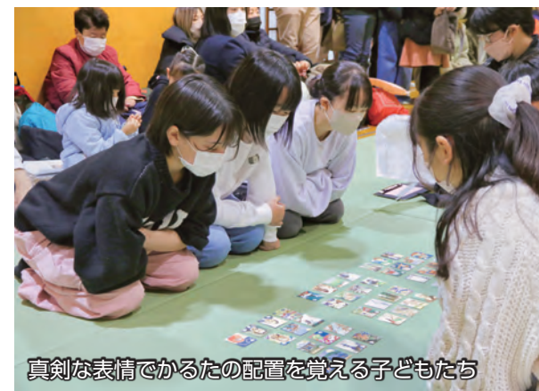
真剣な表情でかるたの配置を覚える子どもたち