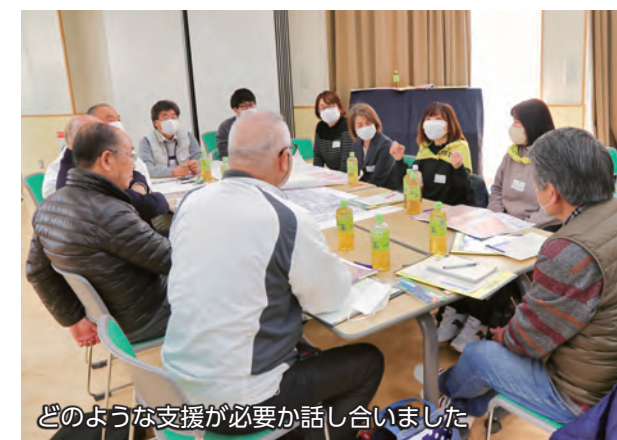
どのような支援が必要か話し合いました

1月31日、宮郷公民館で「地域ミーティング」が開催されました。会場では、市民や障害者、市職員らが、自力での避難が困難な障害者や高齢者を含めた地域全体の安全管理について話し合いを行いました。参加者は、災害時に自分だけではなくみんなでも避難することができるよう、要支援者への理解を深め、防災力の向上に努めました。