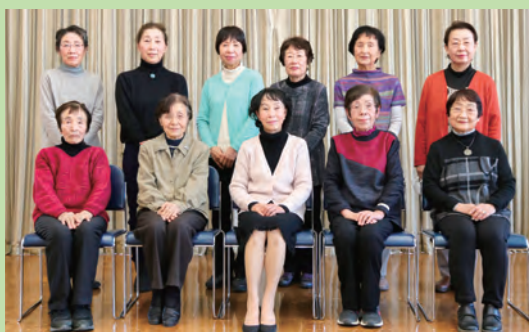
サークル名 童謡を歌う会「カナリヤ」