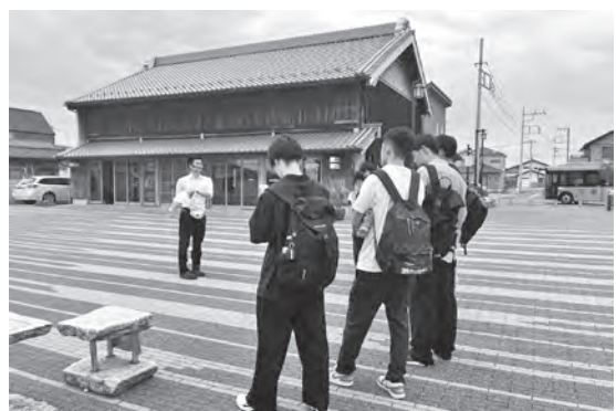
「まちなかシンポジウム」でのまちなかガイドの様子

これらの「地域を知る活動」を通して、伊勢崎市を理解しリスpektする姿勢を日々養っています。