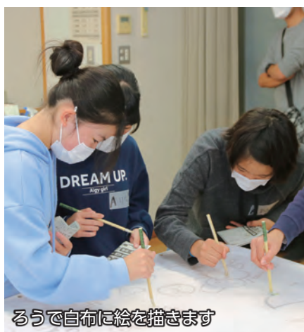
ろうで白布に絵を描きます