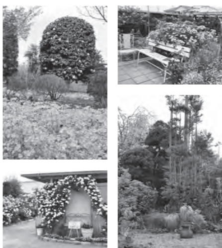
▲令和5年度に公開された庭の一例

市内の26人の花愛好家が、オープンガーデンとして自宅の庭を公開します。オープンガーデンのプレートとのぼり旗が目印です。マナーを守って見学しましょう。 公開日 4月13日(土)・14日(日) 5月11日(土)・12日(日) 6月8日(土)・9日(日) 時間 午前10時～午後5時 ※公開日や時間は庭ごとに異なります。詳しくはオープンガーデン散策マップで確認してください。マップは4月以降に清掃リサイクルセンター21、市民情報コーナー(市役所・各支所)、各公民館、各