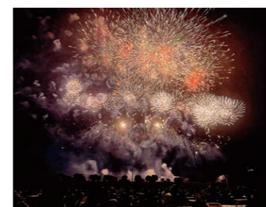
◀2023年度グランプリ作品「特等席」