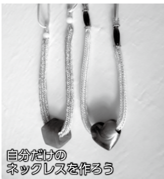
自分だけのネックレスを作る

リリアン編みのネックレス作り教室 清掃リサイクルセンター121(☎32-3166) 期日 5月19日(月) 時間 午前10時～正午 会場 清掃リサイクルセンター 対象 市内に在住または在勤の人 定員 30人(先着順) 参加料 1700円(材料費) 申し込み 4月25日(金)午前9時から電話で清掃リサイクルセンター121へ