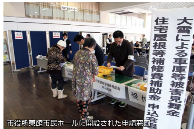
市役所東館市民ホールに開設された申請窓口

市では、2月14日・15日の大雪により、車庫やカーポートに被害があった人に見舞金を交付しています。また住宅屋根などに被害があり補修を行った人への補助金の交付申請が3月20日から始まり、3月31日現在、車庫・カーポート被害の見舞金の交付は5,171件、住宅屋根などの補修費補助金の申請は319件ありました。