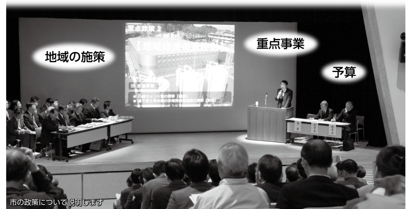
市の政策について説明します