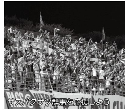
ザスパクサツ群馬を応援しよう