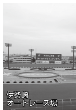
伊勢崎 オートレース場

申し込み 住所・氏名(ふりがな)・生年月日・性別・電話番号を記入したはがきを郵送、またはファクス・メール