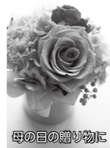
母の日の贈り物に

プリザーブドフラワーの母の日のアレンジ教室 殖蓮公民館(☎26-4560) 期日 5月2日(金) 時間 午前10時～正午 会場 殖蓮公民館 対象 市内に在住または在勤の人 定員 25人(先着順) 内容 カーネーションやバラのプリザーブドフラワーを使って、母の日の贈り物やインテリアとして長く楽しめるアレンジを作ります 参加料 2500円(材料費) 申し込み 4月23日(水)から直接または電話で殖蓮公民館へ