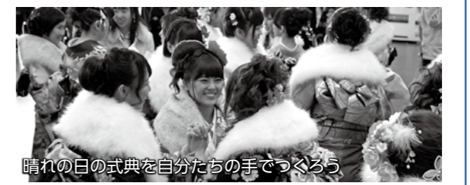
晴れの日の式典を自分たちの手でつくろう

は、補助金(下水道が使えるようになってから3年以内)や融資制度があります。詳しくは、下水道管理課または公共下水道排水設備指定工事店に問い合わせてください。