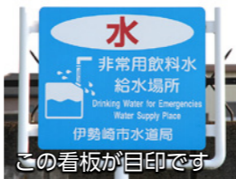
この看板が目印です

害時でも水の供給を行うことができます。災害地域給水拠点は防災マップや市ホームページで確認できます。また2トンの水を運搬できる給水車があり、断水地域に水を供給することができます。 応急給水訓練 さらに市では、万が一に備え、災害地域給水拠点で応急給水の訓練を行うなど、災害が起きたときでも、普段の生活に欠かすことのできない水を市民の皆さんに供給できる体制を整えています。