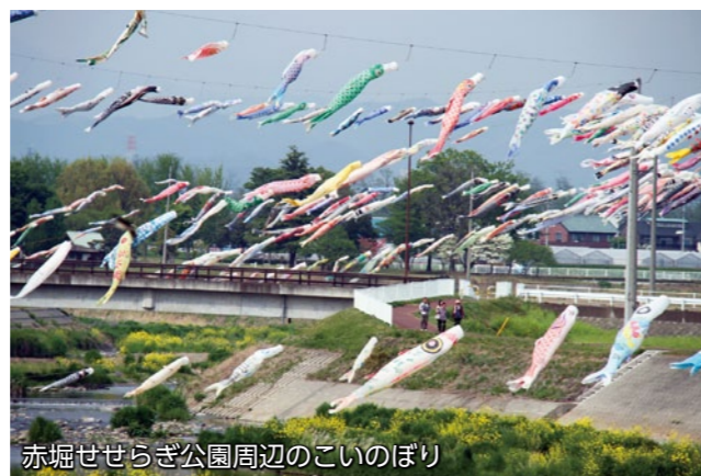
赤堀せせらぎ公園周辺のこいのぼり