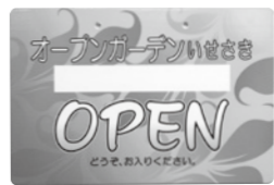
▲このプレートが目印

市内の花愛好家が、オープンガーデンとして自宅の庭を公開します。オープンガーデンのプレートと、のぼり旗が目印です。マナーを守って見学しましょう。