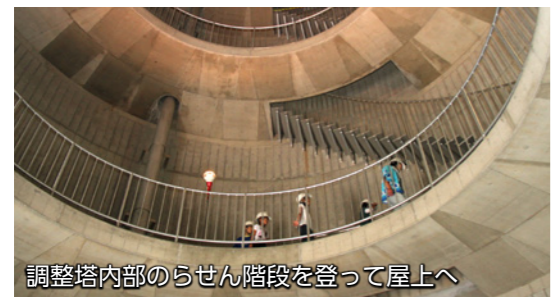
調整塔内部のらせん階段を登って屋上へ

うか。東日本大震災の時や、その後の計画停電が実施された時も、市では市内の浄水場・配水場から各家庭に水道水を供給していました。 停電への備え 各浄水場・配水場には、大規模な停電が起きたときに備えて自家発電機が用意されています。さらに調整塔には常に一定量の水が蓄えられており、電気が使えなくても、水の供給がすぐには止まらない設備が整っています。 断水への備え 大きな災害が起こり、断水になってしまった場合の備えもあります。市内に11カ所ある災害地域給水拠点では、災