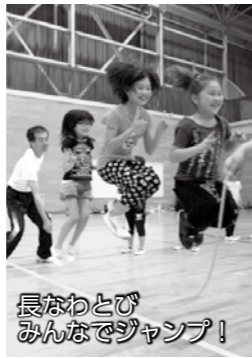
長なわとび みんなでジャンプ!

種目・会場 左表のとおり 対象 市内に在住の人 参加料 無料 ※参加賞があります ※申し込み 当日直接会場へ ※ゲートボール・グラウンド