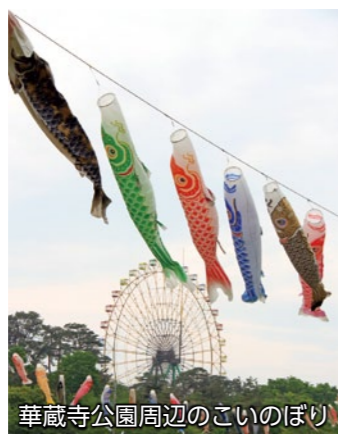
華蔵寺公園周辺のこいのぼり

本市を南北に流れる粕川流域の2カ所で、こいのぼりが揚げられました。赤堀せせらぎ公園周辺のサイクリングロードでは、4月6日から5月10日まで約450匹、華蔵寺公園周辺では4月20日から5月11日まで約150匹のこいのぼりが、春の風をいっぱい受け、気持ち良さそうに泳いでいました。