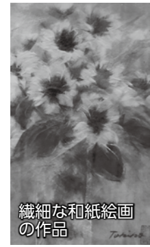
繊細な和紙絵画の作品