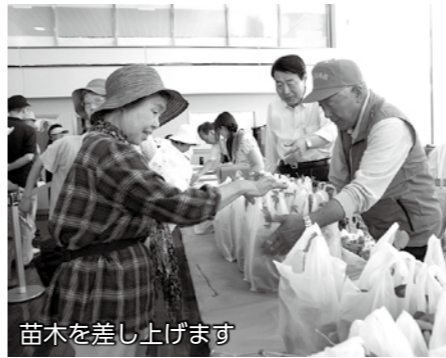
苗木を差し上げます

期日 6月5日(木) 時間 午前10時～正午 会場 市役所東館1階市民ホール 内容 ●この夏、ごみの減量とグリーンカーテンに取り組むことを宣言した人に、ゴーヤなどのつる性植物の苗とエコグッズを差し上げます(先着順)