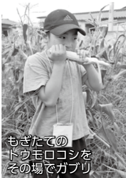
もぎたてのトウモロコシをその場でガブリ