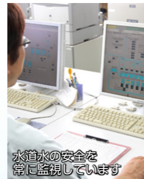
水道水の安全を常に監視しています

5か所の浄水場の備え もしも大きな災害が起こったら。もしも大規模な停電が発生したら。水道水の供給は止まってしまうのでしょうか。 市では、定期的に各浄水場・配水場の設備を点検・整備しています。また水道法で定められた51項目の水質検査を行い、皆さんがいつでも安心して、快適に水道水を利用できるように努めています。