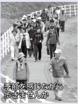
季節を感じながら歩きましょう

対象 健康づくりに関心があり、運動制限のない人 参加料 無料 用意する物 タオル・飲み物 問い合わせ 健康管理センター ☎(23)69755