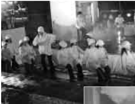
◆イベント開始を告げる ダンピアいせさき