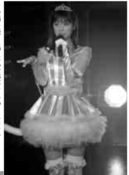
▶会場を盛り上げた小倉優子さんのミニコンサート