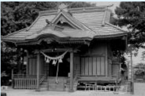
旧日光例幣使道沿いにある「柴町八幡神社社殿」