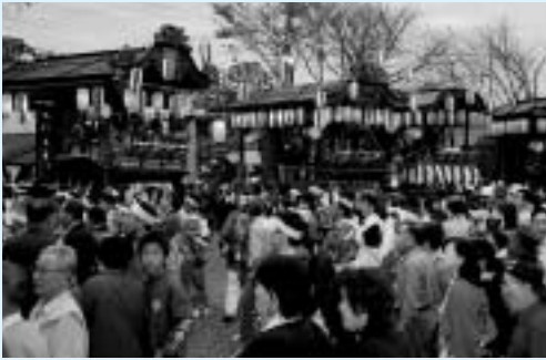
屋根周りに密度の高い彫刻を飾る「波志江の屋台」