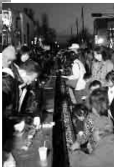
◀見事に焼きあがった長串まんじゅう

1月11日、新春恒例となった上州焼き饅祭が行われました。伊勢崎神社では、新成人による文字入れがされた直径55cmの大串まんじゅうに、ミスひまわりがみそだれを塗る神事が行われ、本町通りでは、市民80人が参加して長さ20mの長串まんじゅうが焼かれ、参加者はおいしそうにほお張っていました。