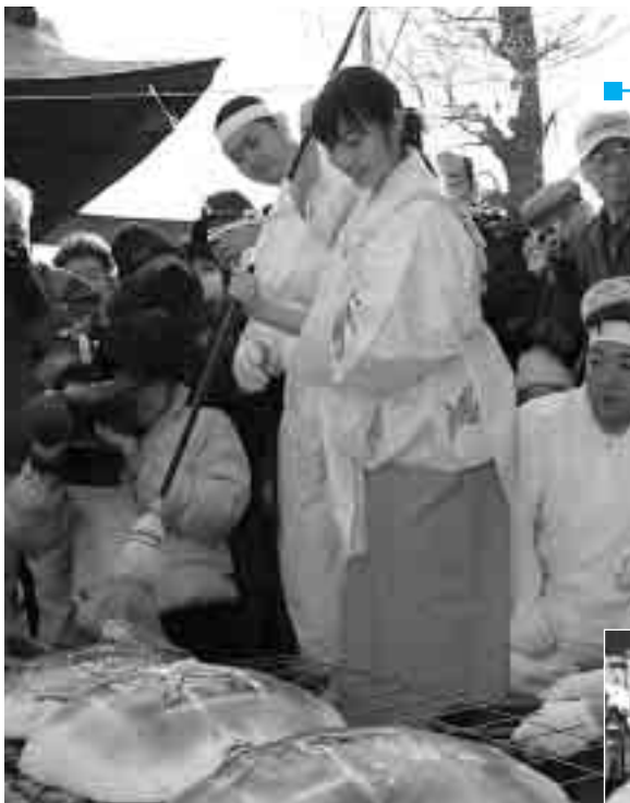
みそだれを塗るミスひまわり