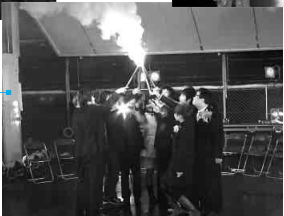
4市町村長と新成人による集火式

大みそかから元日にかけて合併記念イベント「メモリアルカウントダウン」がオートレース場で行われ、家族連れなど約6,000人が新市誕生の瞬間を楽しみました。4本のトーチを合わせる集火式や2005発の打ち上げ花火、タレントの小倉優子さんによるミニコンサートなどで新市誕生を祝福しました。