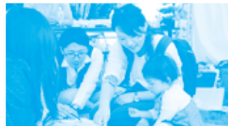
明日の郷土を築く青少年の集い Youth Festival for the Future of Isesaki