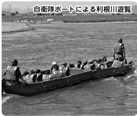
自衛隊ボートによる利根川遊覧