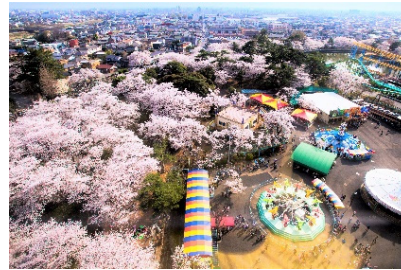
関連するSDG s のゴール

地域資源や観光資源を生かした誘客、関係人口の創出・拡大、地方居住の推進等、魅力ある観光づくりやスポーツイベントの充実を推進し、交流人口や関係人口の拡大に努めるとともに、UIターン等の推進や本市にある大学に通う学生に対する本市内への就職を促進するなど、転入者の増加を図る事業。