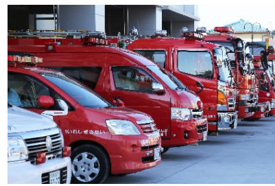
関連するSDG s のゴール

安心できるまちづくりや空き家対策の推進等、地域防災体制の充実や防犯体制を強化し、安心安全な暮らしの実現に取り組むとともに、快適で安全な住環境の保全を図る事業。