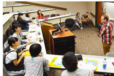
関連するSDG s のゴール

地域に根ざした特色ある教育の推進やグローバル教育の推進等、地元愛を育むふさと学習を推進するとともに、次代のまちづくりや地域の活性化を担う人材を育成する事業。