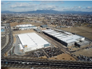
関連するSDG s のゴール

地域産業の活性化や付加価値の向上、就労への総合的支援、企業誘致の推進、農業の成長産業化等、魅力ある多様な就業機会を創出し、誰もが働きやすい環境を整備することにより、継続的に安定した雇用機会を創出する事業。