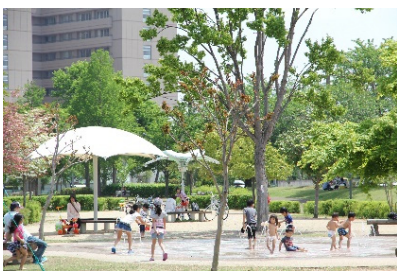
関連するSDG s のゴール

地域医療体制の充実、住み慣れた地域で安心して自立した生活を送ることができる体制の整備、魅力ある居住環境の整備、交通体系の確立等、魅力ある都市環境を構築して定住の促進を図るとともに、時代にあった持続可能なまちづくりを推進する事業。