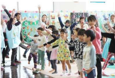
関連するSDG s のゴール

母子保健サービスの充実や子育て支援の充実等、安心して子どもを生育てられる環境の整備を図り、転出の抑制と出生数の増加に取り組むとともに、仕事と子育てが両立できる環境づくりを促進する事業。