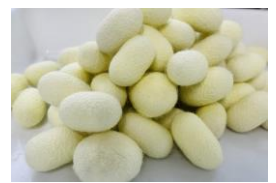
今年、田島弥平旧宅案内所で行った養蚕でとれた繭