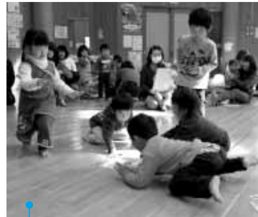
◀ 絵札に飛び付く子どもたち