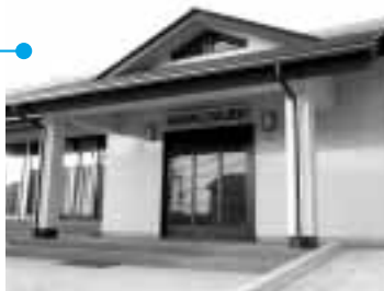
新築された西久保町二丁目区公民館

西久保町二丁目区では、自治宝くじの収益金で公民館を新たに建築しました。今後は地域交流の活動拠点として、コミュニティ活動などに利用され、地域の一層の発展とまちづくりに生かされていきます。