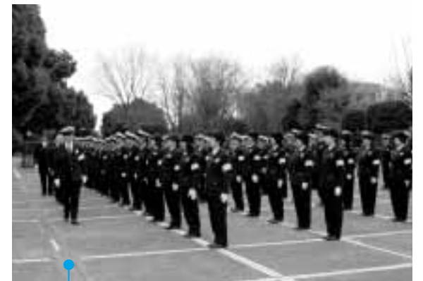
所持品の点検を受ける交通指導員の皆さん