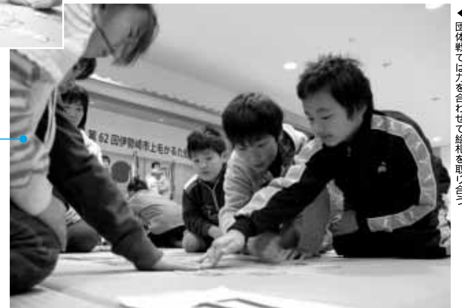
◀ 団体戦では力を合わせて絵札を取り合う

1月25日、「市上毛かるた競技大会」が市民プラザで開催され、11地区の予選を勝ち抜いた小・中学生が、熱戦を繰り広げました。参加した皆さんは、札を読み上げる声に素早く反応し、勢いよく絵札に手を伸ばしていました。