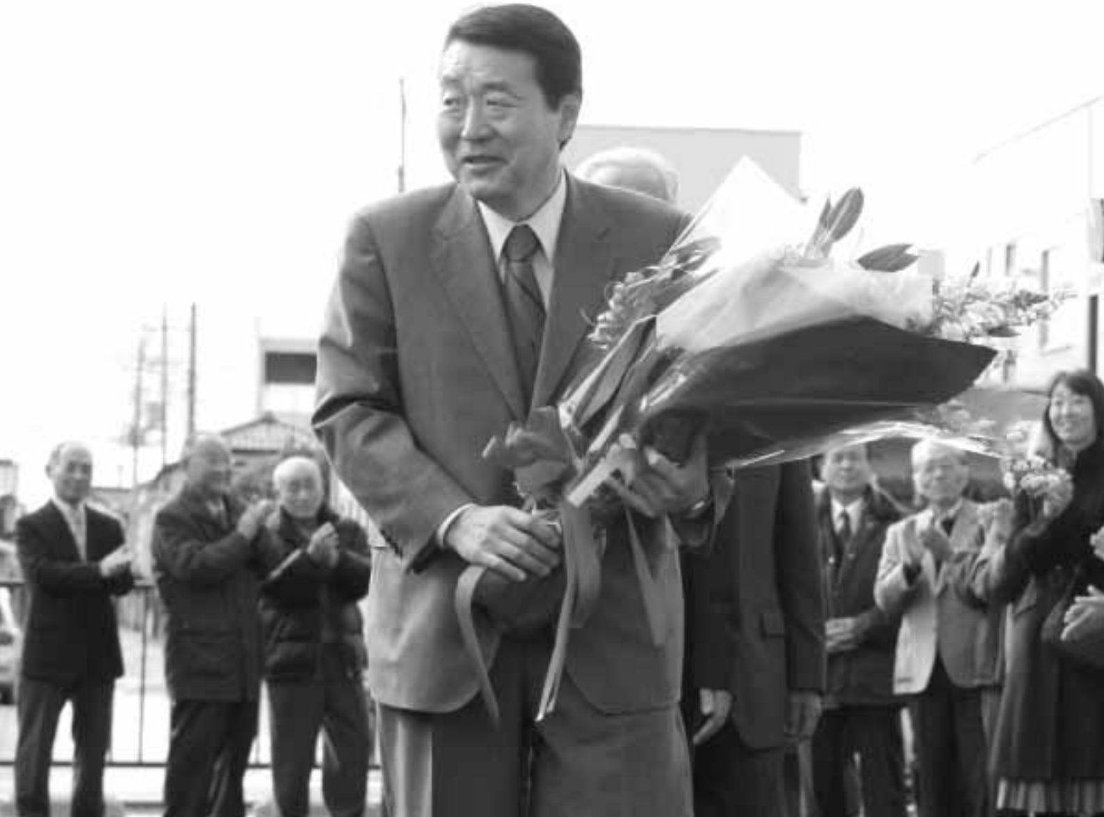
1月23日、五十嵐清隆新市長が初登庁し、大勢の市民や市職員に拍手で迎えられました。五十嵐市長は、「市民の暮らしを最優先する、思いやりのある市政をお約束します」と力強くあいさつをしました。