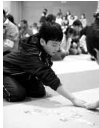
▶ 個人戦は1対1の真剣勝負

1月12日、「交通指導員初点検」が文化会館で行われました。交通指導員の皆さんは、市長らによる服装や所持品の点検を受けた後、交通整理の基本動作訓練を行い、地域の交通安全を担う決意を新たにしていました。