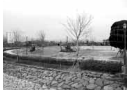
◀ 生まれ変わる波志江沼環境ふれあい公園

合併記念公園にふさわしい水と緑があふれる公園として整備を続けます。また、緑化フェアの会場運営に、多くの人にかかわっていただいたことを踏まえ、公園の維持管理に市民の皆さんが参加する方法も検討していきます。