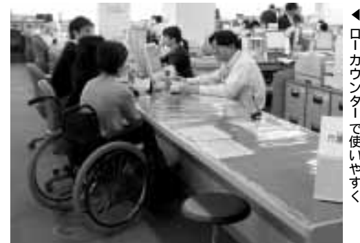
◀ ローカウンターで使いやすく

昨年11月に完成した市役所東館は、人に優しいユニバーサルデザインを推進する庁舎を目指して建設しました。証明書を申請する窓口はローカウンターとし、また、各階に多目的トイレを設置しました。