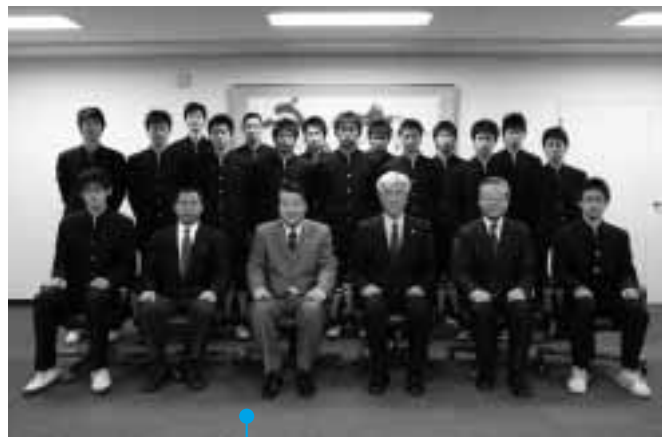
県立伊勢崎高校男子バレー部の選手ら