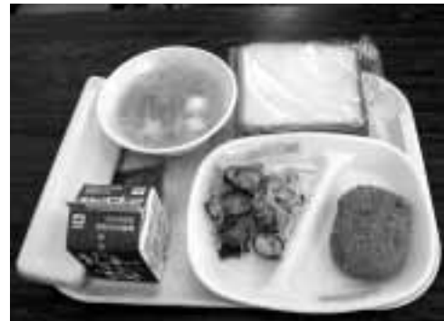
◀ 毎日の給食に欠かせない牛乳

各学校から学校給食調理場に集められた牛乳パックは、月に3回古紙などのリサイクル業者が収集し、トイレトーパーと交換されます。トイレトーパーは、各学校へ配布しています。