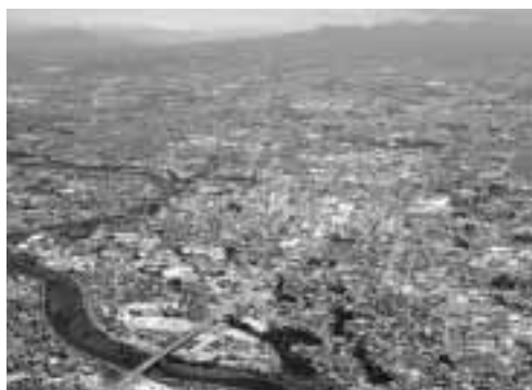
◀ 特例市へと移行した本市

市町村合併して20万都市となり、特例市に指定されましたが、どのように市政に反映されますか。