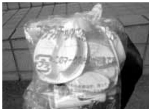
◀ 分別収集にご協力を

プラスチックごみの分別を始めて、「プラマーク」の付いた製品が多いことに驚きました。資源の再利用がこのまま順調に進むことを望みます。