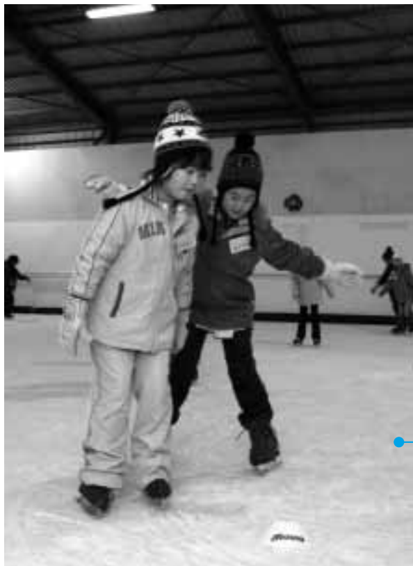
転ばないように、足元をよく見て

2月2日から20日まで、「スケート教室」が伊勢崎スケートセンターで行われました。慣れないスケート靴や氷の感触に初めは戸惑う子どももいましたが、何度かリンクに出るうちに、こつをつかんで、すいすいと滑れるようになっていました。