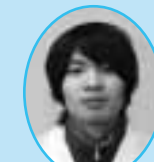
栄養士からのひと言