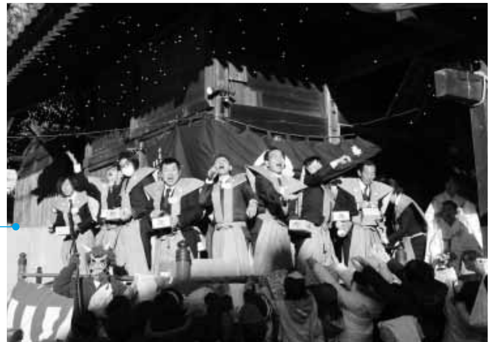
掛け声とともに一斉に豆がまかれる

2月1日、「豊武神社節分祭」が同神社で行われ、かみしも姿の年男20人が、威勢よく豆をまきながら、無病息災・家内安全を祈りました。境内は、福を求めて集まった大勢の老若男女でにぎわっていました。