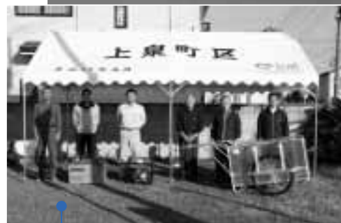
◀ 購入した備品（馬見塚清水町・上・上泉町・下）