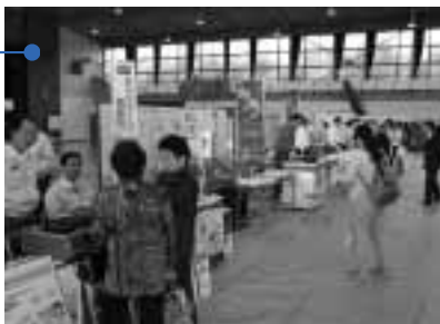
ずらりと並んだ情報コーナー

10月23日、緋の郷で消費生活展が開催されました。食料品の販売やダンス発表会、防災体験などが行われたり、たくさん立ち並んだ情報コーナーでは来場者はくらしに役立つさまざまな情報の説明に熱心に聞き入っていました。