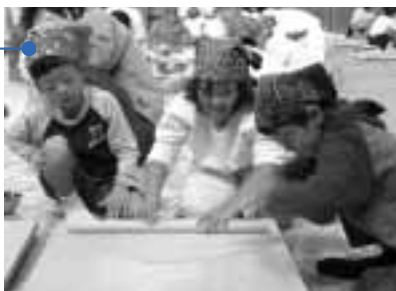
そば打ちに挑戦する子どもたち

10月8日、グリーンパークでそばの里はなまつりが開催。地元産のそばやそばまんじゅうが振舞われました。そば打ち体験では、台東区や寺泊町の子どもたちも参加。初めての体験に戸惑いながらも笑顔でそばを打っていました。