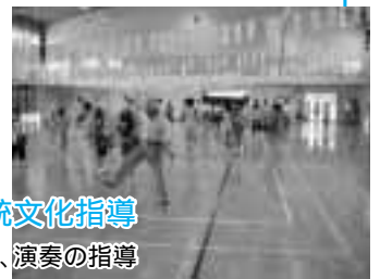
小学校での伝統文化指導