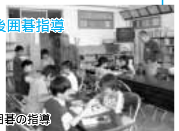
小学校の放課後囲碁指導