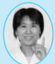
栄養士からのひと言

マリネは、魚などに利用してもおいしくできます。マリネの酢とウスターソースはお好みで調節してください。