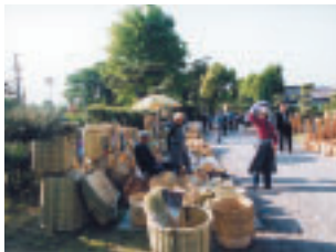
泉龍寺の参道に立ち並ぶ露店