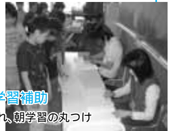
小学校での朝学習補助