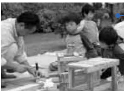
親子で楽しんだ木工体験