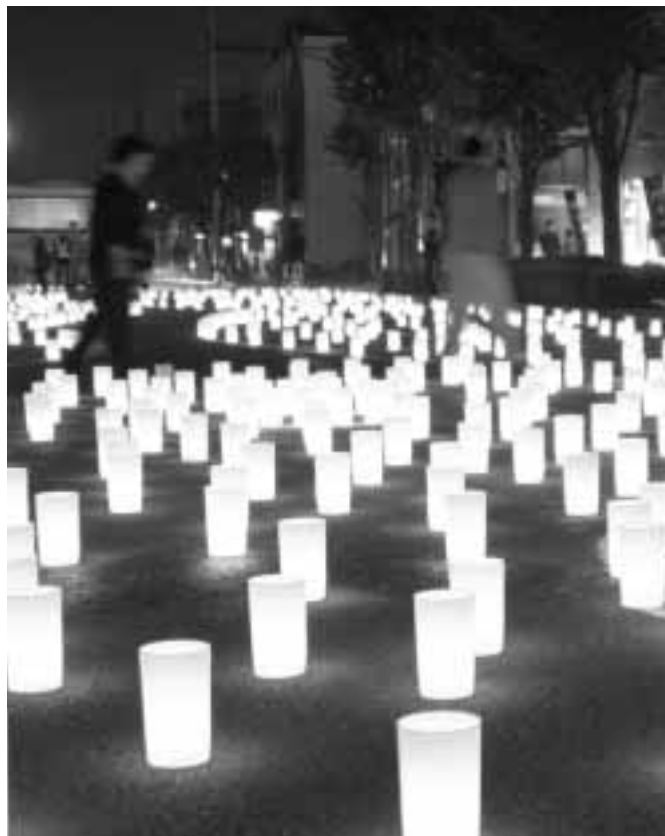
伊勢崎神社西側道路はろうそくの光でいっぱい

10月16日、市民にさまざまな体験を通して交流してもらうため、緋の郷で第31回クリーンフェスティバルが開催されました。大勢の子どもや家族連れが参加し、クイズやゲーム、大抽選会、木工体験などを楽しみました。