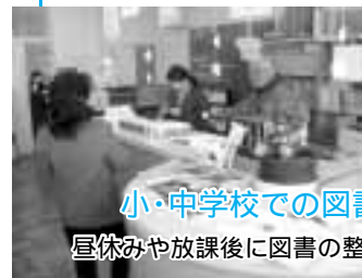
小・中学校での図書館ボランティア