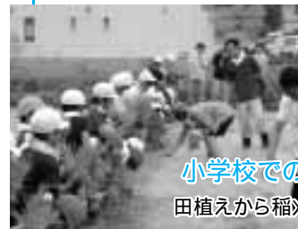
小学校での米作り補助指導