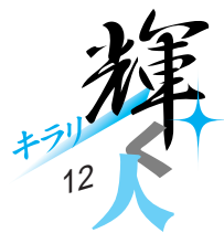
話題の人・出来事・心あたたまることがらを紹介するコーナーです

期日・時間 平成18年2月7日(火)から9日(木)まで 午後6時～9時 平成18年2月11日(祝)・12日(日) 午後1時～5時30分 会場 上武大学(戸谷塚町) 対象 パソコン初心者 定員 各30人 内容 ウィンドウズの基本操作(文書作成など) 参加料 3,000円(教材