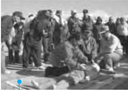
◀ 関心の高かったAEDの講習