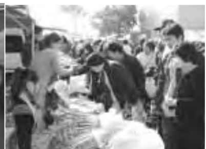
採れたて野菜の即売会