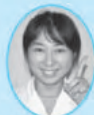
栄養士からのひと言