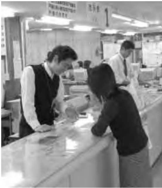
市民に親しまれるサービスを目指しています