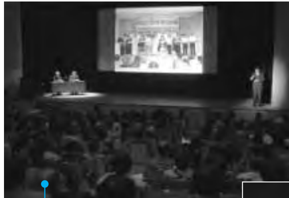
生涯学習実践発表の様子

11月20日に三郷地区、27日に宮郷地区で自主防災組織訓練が実施。この訓練は地区の住民が主体となり毎年2地区ずつ行われています。初期消火や応急手当、はしご車などを体験した皆さんは、本番さながらの訓練に真剣な表情で取り組んでいました。