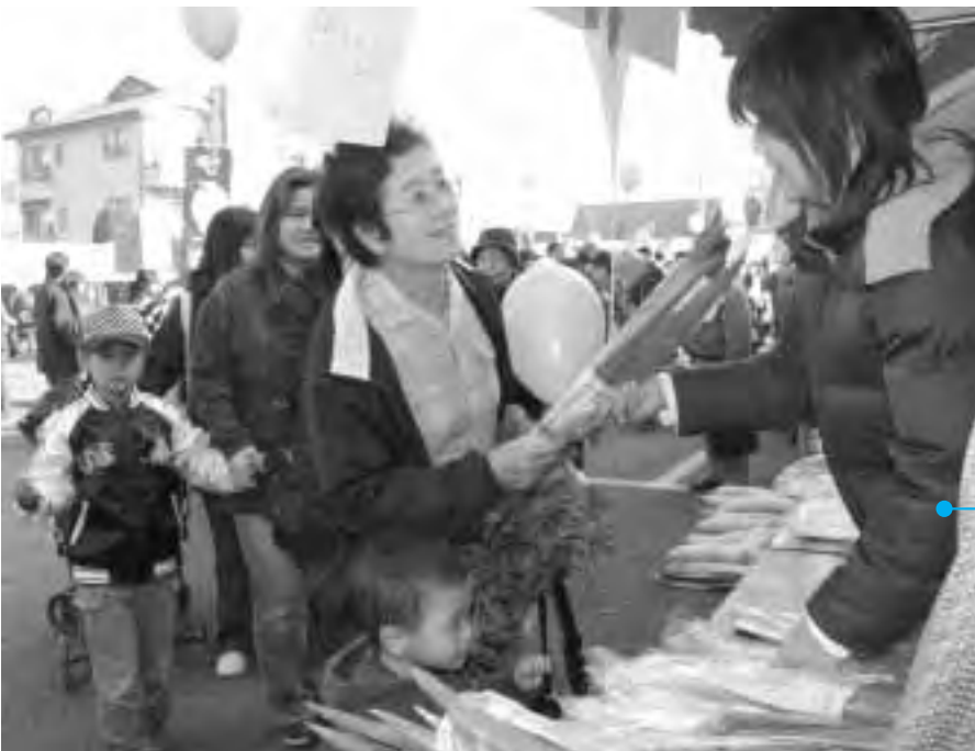
毎年恒例の下植木ねぎの無料配布