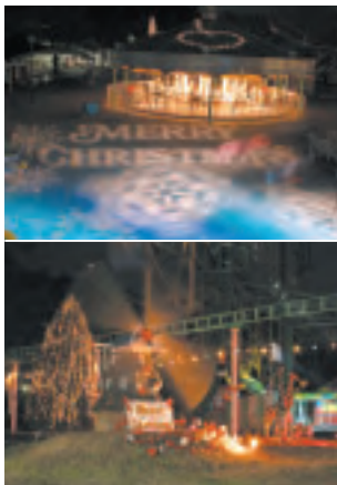
ナイトイベントでライトアップされた園内（昨年の様子）