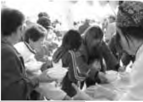
▶ 炊き出し訓練での豚汁配布