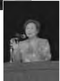
◀ 海老名香葉子による記念講演

11月20日、文化会館で生涯学習大会が開催。今年は名和地区の生涯学習活動を紹介。また、海老名香葉子さんを招き「泣いて、笑って、がんばって 人生は精一杯、明るく生きなきゃ!」と題した記念講演が行われました。