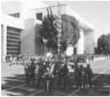
はしご乗りの妙技を披露

今回(平成17年)の数値は、市が速報として集計したものです。今後、総務省が発表する数値と異なる場合があります 前回(平成12年)の数値は、旧4市町村の国勢調査人口の合計です