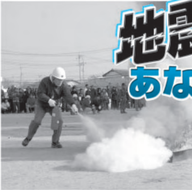
昨年は境地区、三郷地区、宮郷地区で地区住民主体の自主防災訓練が開催。初期消火は被害を軽減させるためにも重要です

1月15日(日)から21日(土)までは「防災とボランティア週間」、1月17日(火)は「防災とボランティアの日」です。防災の基本は「自分の身の安全と財産は自分で守る」ことです。防災には、これで十分というものはありません。