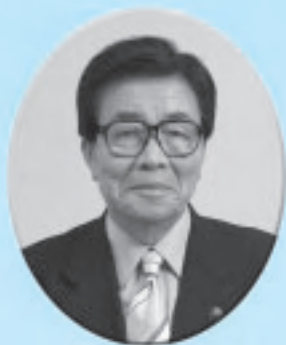
伊勢崎市長 内一雄