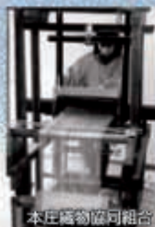
本庄協働協同組合