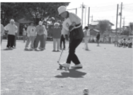
狙い澄ました一球