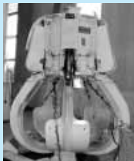
頑丈な5本のごみクレーン

リサイクルセンター21の焼却施設に、ごみクレーンがあります。高さ約2・7メートル、幅約2・2メートル、5本のごみクレーンがあり、1回で約1トンのごみをつかむことができます。