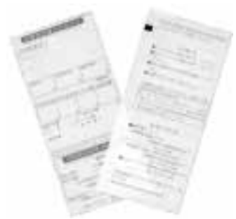
水道検針票(右が裏面)