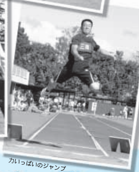
カいっばいのジャンプ