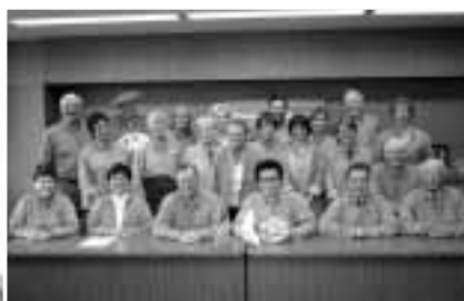
市民訪問団の皆さん