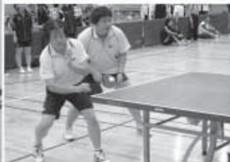
力を合わせたチームプレー