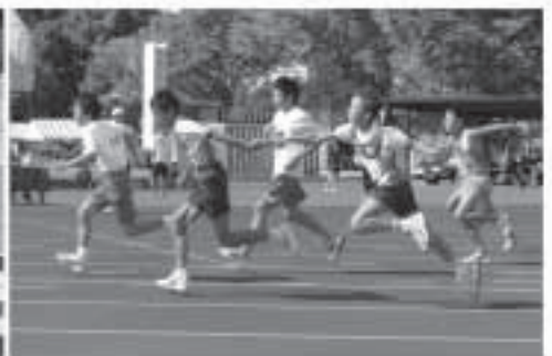
バトンに気持ちを込めて