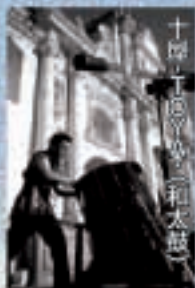
十層十徳の和太鼓