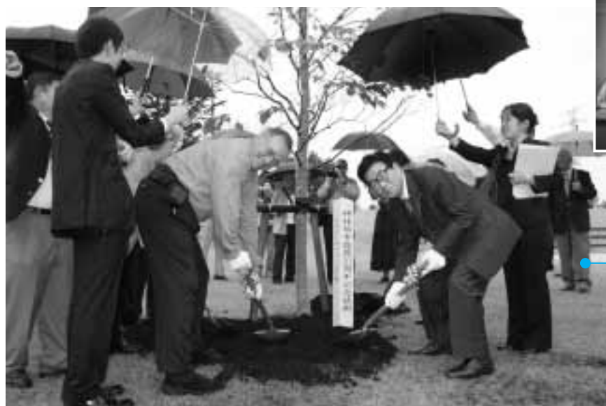
市民のもり公園で行われたハナミズキの記念植樹

9月30日・10月1日、旧森村家住宅で緋の魅力展が開催されました。多数の素晴らしい作品が展示され、訪れた人たちを魅了していました。また、体験コーナーでは子どもたちが初めての機織りに挑戦していました。