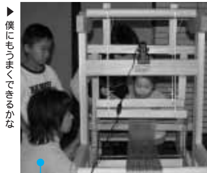
▶僕にもうま〜くできるかな

9月30日、JAみさと支所と三郷公民館でそばの里はなまつりが開催。そばの試食やそば打ち体験などが行われました。参加した人たちは地元産のそばを味わいながら、早食い競争などの催しを楽しんでいました。