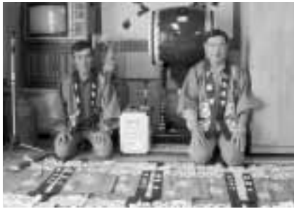
購入したはっぴなどのお祭りグッズ