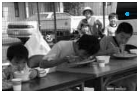
そばの早食い競争に参加した子どもたち