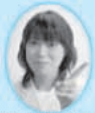
栄養士からのひと言

A 本市でも児童の安全対策については、多方面から検討を行い、対策を行ってまいります。 いくつか例を挙げると、次のとおりです。 学校やPTA・地域ボランティアによって通学路の安全点検を行うとともに、危険と思われる個所の確認や危険回避の方法について話し合いを行っています。また、いざというときに子どもが助