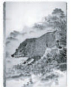
▲本年の干支の掛け軸