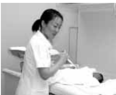
地域医療を担う力に

市民病院では、本年3月1日および4月1日採用の職員を次のとおり募集します。 採用試験申込書は、市民病院2階総務課で配付しています。また、市民病院ホームページ( http://www.hospital-isesakigunma.jp/ )から印刷することもできます。 なお、郵送による書類の請求・提出はできません。受験者本人または代理人が直接手続きしてください。