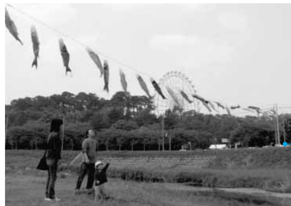
こいのぼりを楽しむ家族連れ