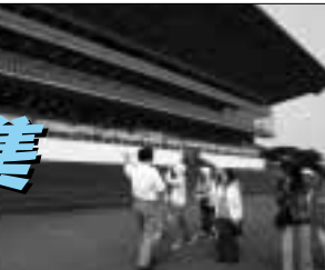
オートレース場の説明を聞く参加者

見学コース 市役所 清掃リサイクルセンター21 第二学校給食調理場(給食の試食) 竜宮浄水場 オートレース場 市役所