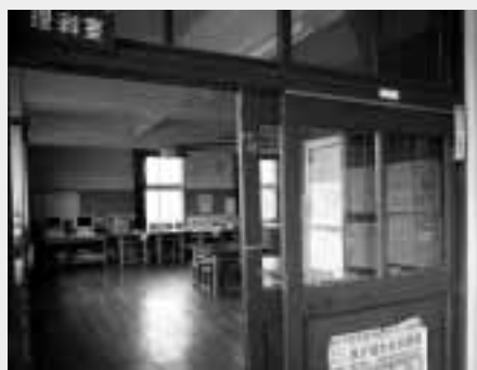
昭和の趣を残す理科室

建設してから46年が経過した旧校舎は、もうすぐその役目を終えようとしています。地域の皆さんに愛されてきた校舎の最後の姿をぜひご覧ください