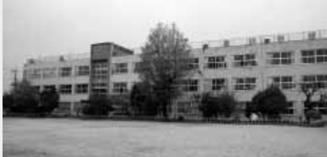
思い出が詰まった旧校舎