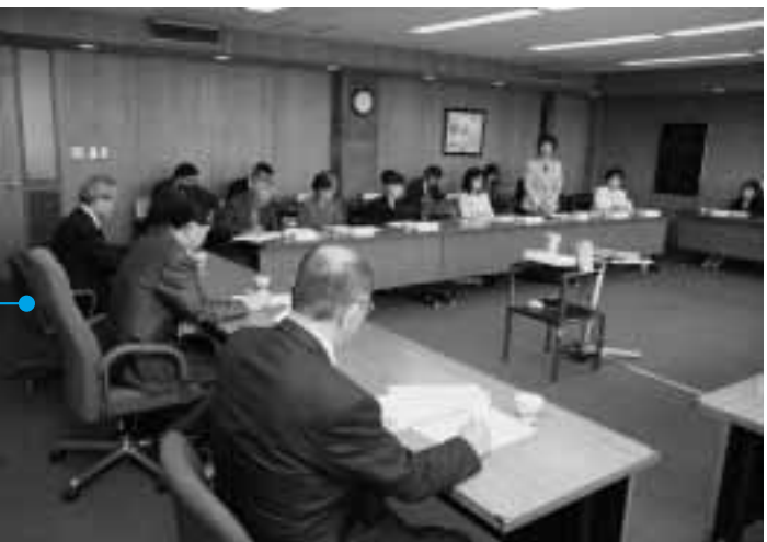
抱負を語るモニター

4月25日、市政モニター委嘱状交付式が市役所本庁で行われ、本年度のモニターとなった20人に矢内市長から委嘱状が交付されました。これから1年間、モニターの皆さんから寄せられる建設的な意見や提案を、市政に反映させていきます。