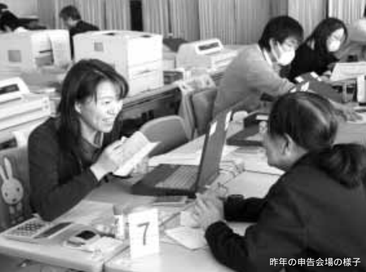
昨年の申告会場の様子

税理士事務所でも無料相談を行っています 期日・内容 2月13日(金) = 還付申告の相談 2月23日(月) = 確定申告の相談 時間 午前10時～午後4時 会場 各税理士事務所 相談内容により有料になる場合があります