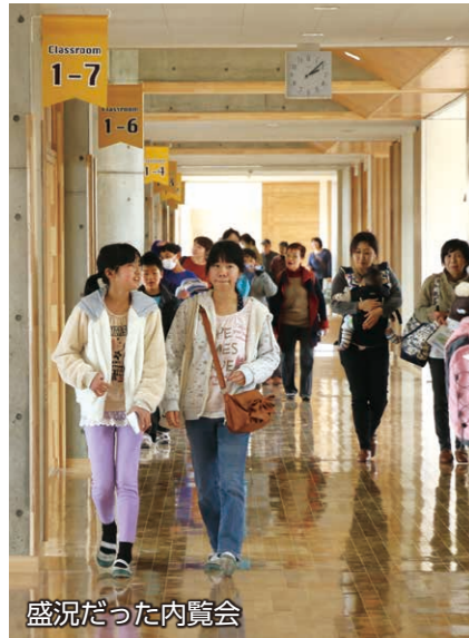
盛況だった内覧会