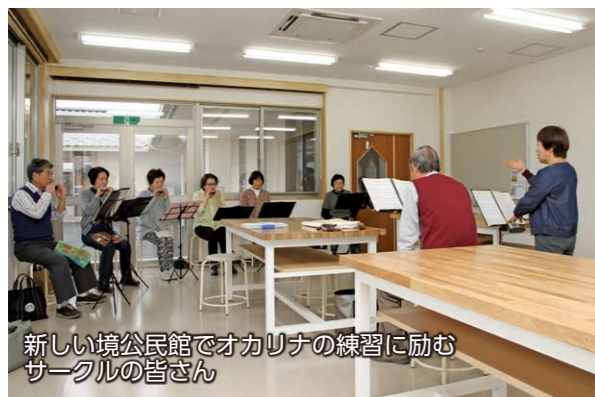
新しい境公民館でオカリナの練習に励むサークルの皆さん

移転・新築工事が完了した境公民館が開館し、4月から利用が始まりました。新しい境公民館は、ホールや調理実習室、工作実習室、和室などをそえた平屋建ての建物です。利用者からは「新しい建物で活動できて気持ちがいいです」との感想が聞かれました。生涯学習活動の拠点として、ぜひ利用してください。