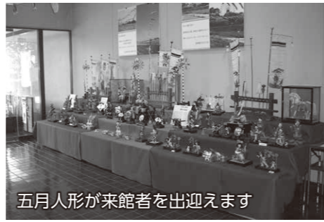
五月人形が来館者を出迎えます

期日 4月25日(土)から5月10日(日)まで ※4月27日(月)・30日(木)・5月7日(木)は休館です 時間 午前9時～午後5時 会場 赤堀歴史民俗資料館 内容 こいのぼりや五月人形などを展示し、端午の節供の由来や習俗を紹介し 入場料 無料 問い合わせ 赤堀歴史民俗資料館(☎63-0030)