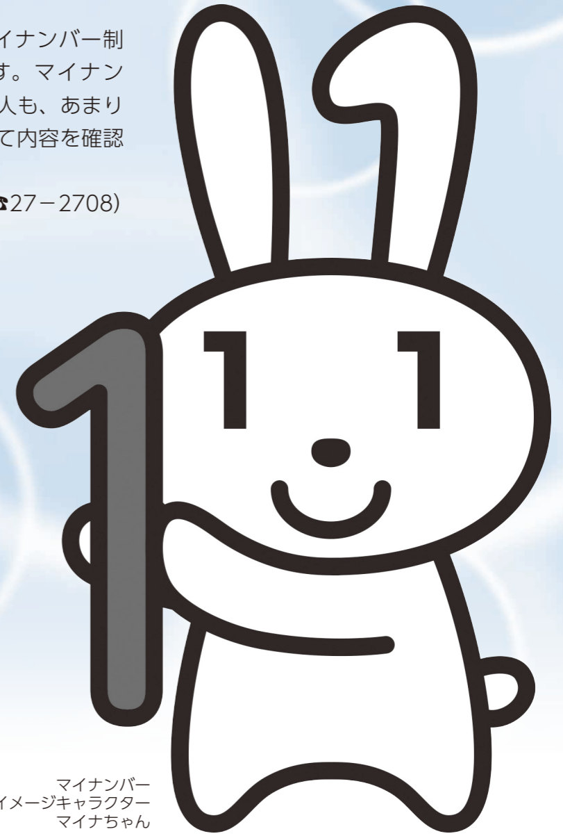
マイナンバー イメージキャラクター マイナちゃん