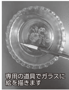
専用の道具でガラスに絵を描きます

期日 5月14日から6月18日までの木曜日(全6回) 時間 午前9時～11時30分 会場 豊受公民館 対象 市内に在住の人 定員 10人(先着順)