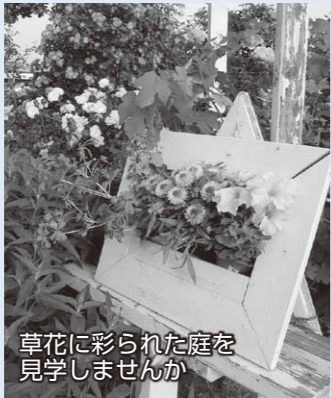
草花に彩られた庭を見学しませんか

期日 5月14日から6月18日までの木曜日(全6回) 時間 午前9時～11時30分 会場 豊受公民館 対象 市内に在住の人 定員 10人(先着順)