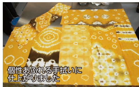
個性あふれる手拭いに仕上がりました

4月15日、清掃リサイクルセンター21で玉ネギの皮を使った染め物講座が開催されました。参加した皆さんは、玉ネギの皮をお湯で煮出して抽出した染料を使って、白い手拭いを染めました。手拭いの一部をつまんで根元をひもで縛ったり、畳んで縛ったりすると、縛ったところは染料が染み込まずに、白い模様になります。完成品はひもを解いて広げるまで、どんな仕上がりになるか分からず、参加した皆さんはわくわくしながら手拭いを広げていました。