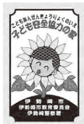
▲このプレートが目印

子ども安全協力の家は、子どもが登下校時などに何か困ったことがあった場合に、助けを求めることができる場所です。子ども安全協力の家には、ひまわりのプレートが掲げられています。保護者の皆さんは、子どもたちと一緒に、通学路などにある子ども安全協力の家の場所を確認しておきましょう。急な雨や体の不調などで困ったときには、子ども安全協力の家に声を掛けるよう、子どもたちに伝えてください。