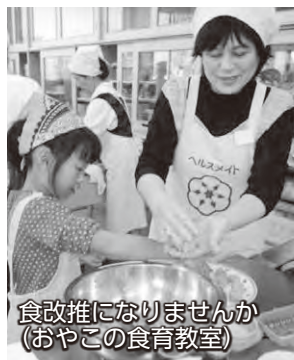
食改推になりませんか(おやこの食育教室)