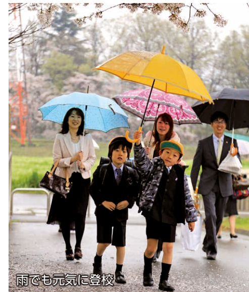
雨でも元気に登校