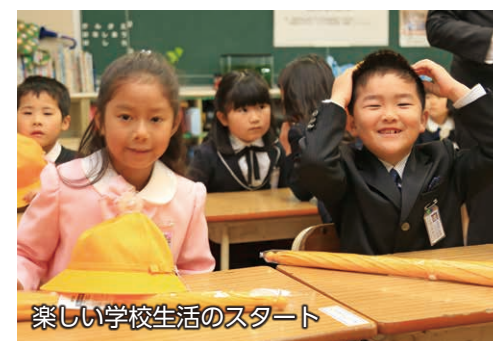
楽しい学校生活のスタート

4月7日、市内の小学校24校で入学式が行われ、1,980人の新1年生が誕生しました。お父さんやお母さんに手を引かれ、少し緊張しながらもうれしそうに登校する新1年生の姿が見られました。