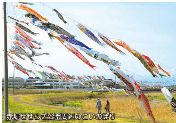
赤堀せせらぎ公園周辺のこいのぼり