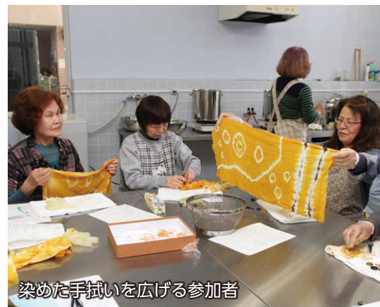
染めた手拭いを広げる参加者