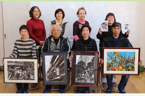
サークル名 伊勢崎切り絵同好会