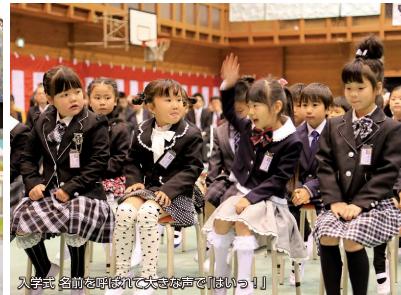
入学式 名前を呼ばれて大きな声で「はいっ!!」