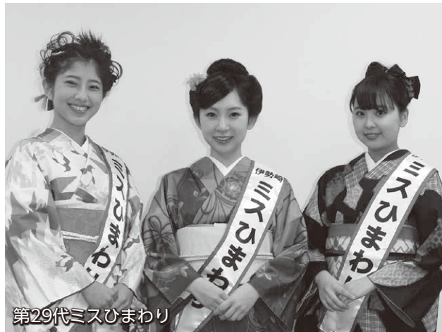
第29代ミスひまわり

期日 5月10日(日) ※小雨決行 時間・内容 ●午前の部(午前10時~11時45分)=和装 ●午後の部(午後1時~3時)=洋装