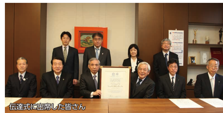
伝達式に出席した皆さん