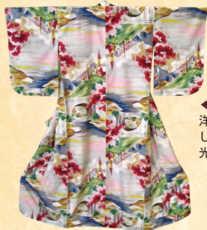
◀経糸、緯糸で西洋の春の景色を表した「併用紺」(市観光物産協会蔵)

とおりに合わせて織らなければならず、高度な技術が必要とされました。伊勢崎銘仙の一つである併用紺は、経糸と緯糸が模様に応じて染められており、絵画のように緻密な模様を表すことができませんでした。その反面、緻密過ぎて力織機(機械織り)では織ることが難しかったため、手織で織ることがほとんどでした。 第二次世界大戦中は金属類回収令により力織機が供出され、全国的に銘仙の生産量が減少しました。足利、秩父、八王子などの銘仙の産地では、力織機の不足により、終戦後銘仙の生産の復興に時間がかかりました。一方、伊勢崎ではその緻密さ故に手織を多く使用していたため、比較的早く生産を再開することができました。戦後、伊勢崎銘仙は高品質で価格が手頃な普段着として、全国で愛されました。