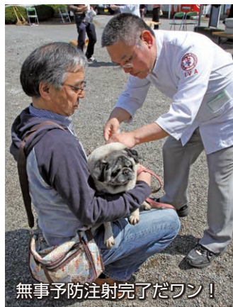
無事予防注射完了だワン！

狂犬病予防注射は5月24日まで、各町内で順次行っています。まだ済んでない犬の飼い主の皆さんは、必ず受けさせましょう。期日、会場など詳しくは広報いせさき4月1日号をご覧ください。