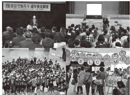
▲昨年の活動の様子

対象 市内に在住または在勤・在学の3人以上で構成された団体で、行政機関が事務局に参加していない団体。または特定非営利活動法人やボランティア団体など、市内を中心