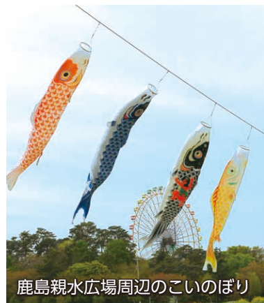
鹿島親水広場周辺のこいのぼり

本市を流れる粕川沿いの2カ所でこいのぼりが揚げられています。鹿島親水広場周辺では5月9日まで、赤堀せせらぎ公園周辺では5月10日までの期間、たくさんのこいのぼりが楽しそうに空を泳ぐ姿を見ることができます。