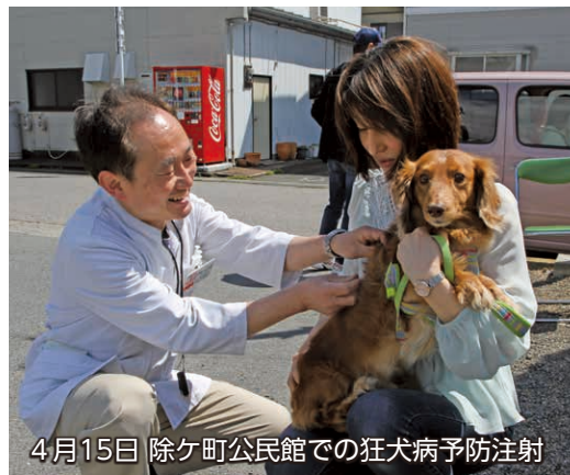
4月15日 除ヶ町公民館での狂犬病予防注射