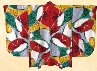
▶アールデコ調のデザイン性の高い模様が特徴の「併用紺」(市観光物産協会蔵)

用する元となったという説があります。伊勢崎銘仙の特徴は、京都の友禅染のような、織った反物を染色する「後染め」ではなく、糸を模様に応じて染めてから織り始める「先染め」であるという事です。先染めの場合、染められた糸を模様の