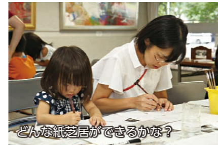
どんな紙芝居ができるかな？