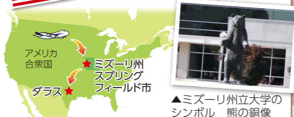
▲ミズーリ州立大学のシンボル 熊の銅像

スプリングフィールド市と伊勢崎市は、1986年に国際姉妹都市提携を結びました。面積は伊勢崎市より広い約211平方キロメートルですが、人口は約15万9千人と伊勢崎市より少ないです。滞在中は雨の降る日や暑い日も何日ありましたが、伊勢崎市よりも比較的湿度が低いため、過ごしやすい日が多かったです。治安が良く、親切な人が多かったため、安心して過ごすことができました。