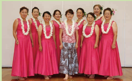
サークル名 フラナニ プアリリレファ