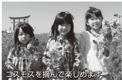
コスモスを摘んで楽しめます

内容 農産物の直売など 問い合わせ あずま経済振興室 ☎(62)9913・☎(62)1311