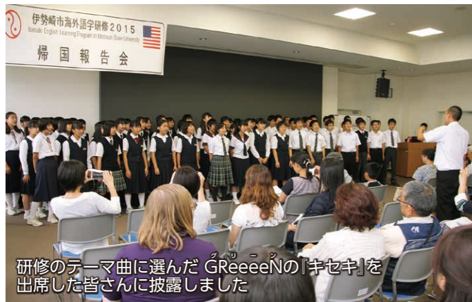
研修のテーマ曲に選んだGReeeeNの「キセキ」を出席した皆さんに披露しました

8月に米国ミズーリ州スプリングフィールド市での語学研修に参加した中学生70人が、9月5日、市役所で帰国報告会を行いました。生徒たちは、現地での授業の様子や生活ぶりなどをスライドで発表したほか、出席した保護者や学校の先生に感謝の気持ちを込めた歌をプレゼントして、研修を通じて成長した姿を披露しました。