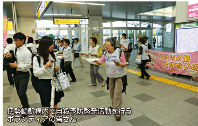
伊勢崎駅構内で自殺予防啓発活動を行うボランティアの皆さん

伊勢崎駅前インフォメーションセンターでは9月8日から11日までの4日間、「自殺予防パネル展」が行われ、展示を通して命の大切さや心の悩みを抱える人を支えることの大切さを訴えました。