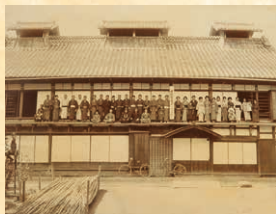
◀大正期の小茂田家の様子

▶小茂田家住宅(長沼町2631)は個人住宅のため、内部は原則非公開。外観は見学できる