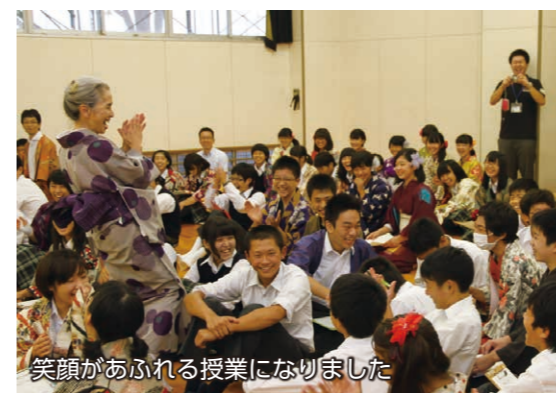
笑顔があふれる授業になりました