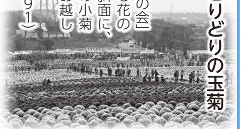
※無料配布は数に限りがあります