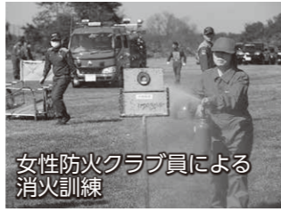
女性防火クラブ員による 消火訓練

期日 10月18日(日) 時間 午前9時30分～11時20分 会場 八斗島ちびっこ広場 内容 消防団員・女性防火クラブ員が、分列行進や消 火訓練などを行い、日頃の訓練の成果を確認します 問い合わせ 消防本部総務課(☎25-3511)