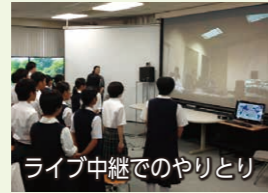
ライブ中継でのやりとり

生徒たちは事前研修で学んだことを胸に、そして現地で社員の皆さんに会えることを楽しみに、スプリングフィールドからダラスへと向かいました。