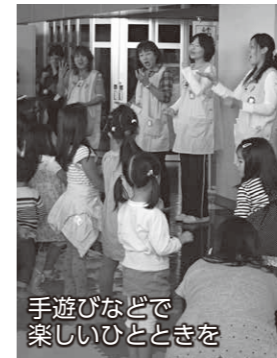
手遊びなどで 楽しいひとときを

子ども保育課(☎27-2751) 期間 10月20日(火)から24日(土)まで 時間 午前9時～午後5時 ※24日(土)は午前10時～午後3時 会場 市役所東館1階市民ホール 内容 パネル展示など。24日(土)は人形劇や楽器遊び、手遊び、体操、簡単な制作遊びなど、親子で楽しめるイベントを行います 参加料 無料