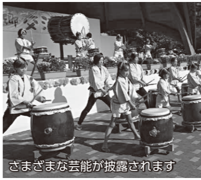
さまざまな芸能が披露されます