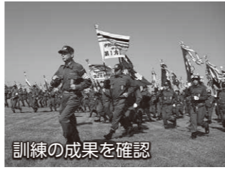
訓練の成果を確認