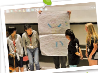
自分たちが考えたキャラクターを英語で説明しています!