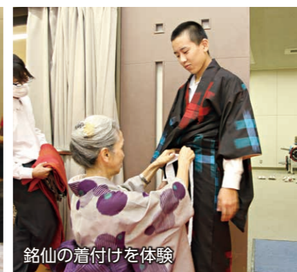
銘仙の着付けを体験