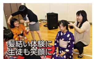
髪結い体験に生徒も笑顔に