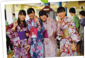
伊勢崎銘仙を着て、伊勢崎サマーフェスティバルに出発!