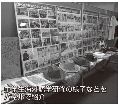
中学生海外語学研修の様子などをパネルで紹介

中学生海外語学研修の写真パネルや、米国ミズーリ州立大学との協定締結資料など、本市のグローバル教育に関するさまざまな資料を展示します。