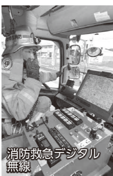
消防救急デジタル無線

大規模災害への対応 近年、本市でも台風による集中豪雨や突風、大雪などといった、これまで経験したことのない規模の災害が発生しています。