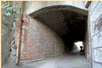
▲住宅街(曲輪町)の細い路地を入 った先に、工場と寄宿舎を結ぶレン ガ造りのトンネルが残っている

伊勢崎地域は養蚕(特に利根川沿岸での蚕種業)が盛んで、織物の生産でも有名でしたが、製糸業はあまり発達しませんでした。その主な理由として、伊勢崎織物(大織)の原料となる玉糸や熨斗糸は、養蚕農家が各家庭で座繰りによって製糸を行ってきたことが挙げられます。徳江製糸工場は、伊勢崎でも数少ない製糸工場の一つでした。