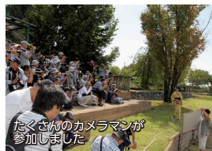
たくさんのカメラマンが参加しました

10月4日、波志江沼環境ふれあい公園で「ミスひまわり写真撮影会」が行われました。第30代ミスひまわりの3人にとっては、初めての撮影会。午前には色鮮やかな伊勢崎銘仙の着物姿で、午後は洋服姿で撮影会が行われました。大勢のカメラマンに囲まれて、始めは少し緊張気味の3人でしたが、カメラマンのリクエストに応えながらポーズを取り、明るい笑顔を見せてくれました。