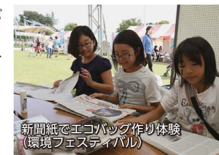
新聞紙でエコバッグ作り体験 (環境フェスティバル)