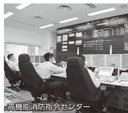
高機能消防指令センター

現場活動支援の強化 消防や救急の各車両に搭載された「消防救急デジタル無線」は、消防指令センターと災害現場を結び、円滑な現場活動の支援を可能にします。映像・音声・データなどの情報を共有し、消防指令センターでそれらの情報を分析・検討して的確な現場支援を行います。