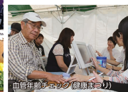
血管年齢チェック (健康まつり)

10月4日、いせさき市民のもり公園で「市民緑花フェア」「環境フェスティバル」「健康まつり」の三つのイベントが同時開催されました。緑の少年団の緑化・環境宣言により開幕した三つのイベントは、多彩なステージ発表や花緑体験教室、企業や環境団体による環境PRブース、健康チェックや体力測定のコナーなど、緑化、環境、健康をテーマに楽しい催しが盛りだくさん。秋晴れの下、会場は大人から子どもまで多くの人でにぎわいました。