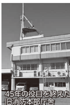
45年の役目を終えた旧消防本部庁舎

消防本部庁舎建て替えの経緯 旧消防本部庁舎は、昭和45年に建設され、平成26年まで本市の防災拠点として地域住民の安心と安全を守り続けてきました。45年という長い歲月とともに、老朽化などさまざまな課題が生じてきました。平成23年3月の東日本大震災では、消防本部庁舎も亀裂が入るなどの被害を受けました。 これを機に平成25年、26年の2年計画による新庁舎建設が始まりました。