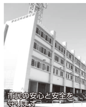
市民の安心と安全を守ります

あらゆる災害に対応できる防災拠点に 完成した新消防本部庁舎は、震度6強の地震にも耐える高い耐震性を備えています。あらゆる災害から、地域住民の安心と安全を守ることが期待されます。新たに導入された「高機能消防指令センター」(以下、消防指令センター)と「消防救急デジタル無線」により、より迅速な消防・救急・救助活動ができるようになります。新しく生まれ変わった消防本部は、高い技術と強い使命感の下、本市の防災拠点として、24時間365日、休むことなく市民の皆さんを見守り続けます。