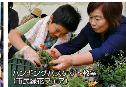
ハンギングバスケット教室 (市民緑花フェア)