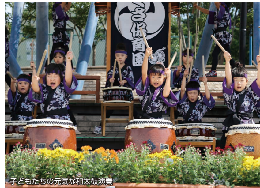
子どもたちの元気な和太鼓演奏