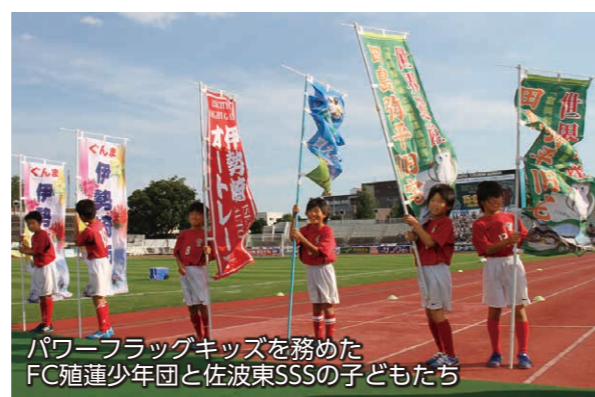
パワーフラッグキッズを務めたFC旭連少年団と佐波東SSSの子どもたち

10月4日、正田醤油スタジアム群馬(前橋市)で行われたザスパクサツ群馬のホームゲームに市民の皆さんが招待されました。京都サンガF.C.を迎えた試合は1対1で引き分け。試合を観戦した皆さんは白熱した接戦を楽しみました。会場では、ザスパクサツ群馬のグッズや市オリジナルグッズが当たる抽選会が行われました。