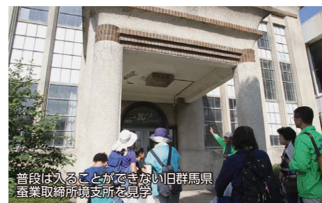
普段は入ることができない旧群馬県蚕業取締所境支所を見学