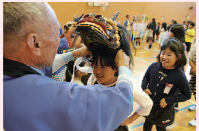
▶100年以上の歴史を持つ獅子頭をかぶる子どもたち