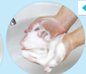
①せっけんをよく泡立てて手のひらを洗う