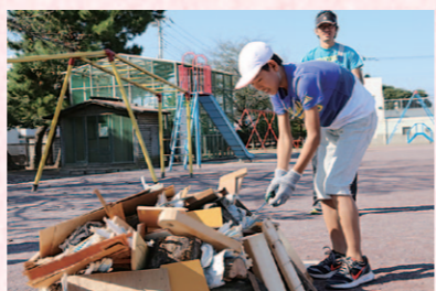
▶校庭の一角に土器を並べ、周りにまきをくべて火を付けます

赤堀小学校では歴史について教科書だけでなく体験を通して学ぶため、6年生の授業で縄文土器作りを取り入れています。7月、子どもたちは粘土から形を作り、縄文土器の特徴である縄目模様などを付けて土器を作成。10月20日、市文化財保護課の職員の協力の下、十分に乾燥させた土器を校庭で焼いて作品を完成させました。授業での体験が歴史の理解を深めることにつながっています。