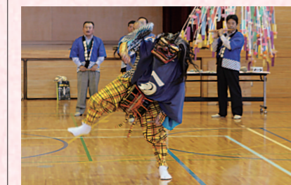
◀伝統ある獅子舞の演舞が披露されました

国定赤城神社奉納獅子舞は、五穀豊穡、疫病災難よけなどを祈願した獅子舞で、約480年前に下野国から伝えられました。10月27日の授業では、国定赤城神社獅子舞保存会の皆さんが獅子舞の演舞を披露し、国定赤城神社奉納獅子舞の歴史や獅子の種類について説明しました。子どもたちは実際に獅子頭をかぶったり、獅子舞の太鼓をたたいたりして、ふるさとの伝統文化を体験しました。