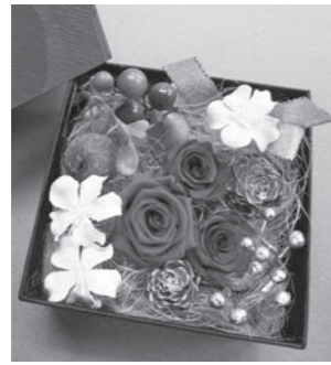
▲箱に花を敷き詰めます

期日 12月14日(水) 時間 午前10時～正午 会場 豊受公民館 対象 市内に在住の人 定員 15人(先着順) 参加料 3100円(材料費)