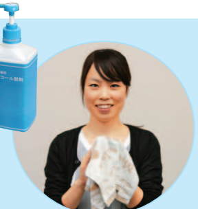
⑨清潔なタオルで手を拭いて、手洗い完了！