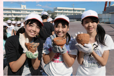
◀焼き上がったら個性あふれる土器が完成!