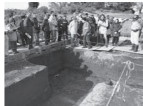
▲発掘の成果を職員が解説します

会場 ふくしプラザ 対象 市内に在住のおおむね65歳以上の入居者 内容 体操、歌、小物作りなどをを行います 参加料 100円(保険料) 申し込み 当日直接会場へ 人権啓発パネル展 人権課(☎27)2730 12月4日(日)から10日(土)までは人権週間です。人権とは何か、人権の尊重とはどういうことか、あらためて人権の大切さについて考えてみましょう。 期日 12月2日(金)から9日(金)まで 会場 市役所東館1階市民ホール 内容 人権啓発パネルや中学生人権作文優秀作品、小・中学生人権啓発ポスター優秀作品を展示します 入場料 無料 幼稚園小・中学校美術展 学校教育課(☎27)2790 期日 12月3日(土)から5日(月)まで 時間 午前9時～午後4時30分 ※5日(月)は午後3時まで 会場 文化会館 内容 子どもたちが一生懸命