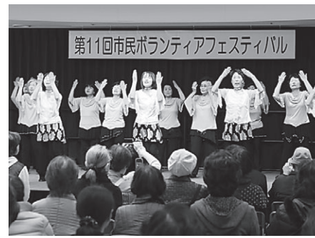
▲華やかなステージ発表

「ブース展示」 ボランティア団体や市民活動団体の活動内容やイベントを紹介します。