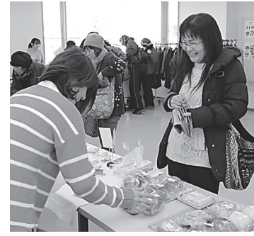
▲バザーで買い物を楽しめます