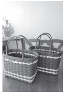
▲バッグを手作りしませんか

期日 2月23日・3月2日・9日の木曜日(全3回) 時間 午前10時～正午 会場 豊受公民館 対象 市内に在住の人 定員 20人(先着順) 参加料 1500円(材料費) 申し込み 1月27日(金)午前