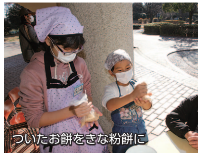
ついたお餅をきな粉餅に