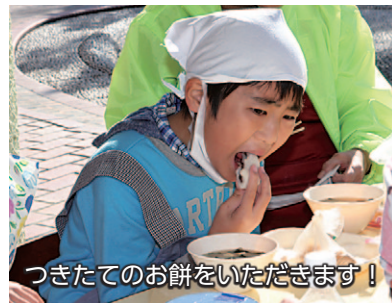
つきたてのお餅をいただきます！

12月18日、まゆドームで「もちつき体験」が行われました。ボランティアの皆さんに手伝ってもらいながら、子どもたちが餅つきを体験。つき上がったお餅をきな粉餅やあんこ餅にして食べました。参加した子どもたちからは「自分でついたお餅がおいしかった」「お餅をつくのが楽しかった」などの感想を聞くことができました。