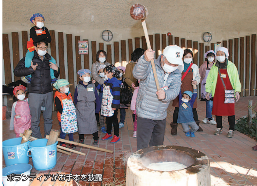
ボランティアがお手本を披露