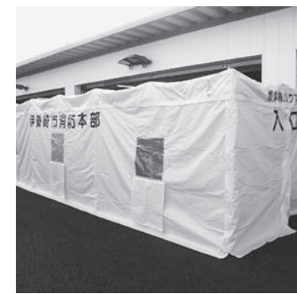
▲煙の怖さを体験できるテント

煙体験用資機材を整備 消防本部総務課(☎253511) 市女性防火クラブでは、自治宝くじの助成金で火災時の煙による視界不良を体験する煙体験用資機材を整備しました。火災予防の重要性を周知し、地域の防火体制を推進します。