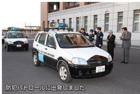
防犯パトロールに出発しました

慌ただしい年末は、犯罪が増加する傾向にあります。犯罪から市民を守るため、12月12日、伊勢崎警察署で「年末特別警戒出発式」が行われ、白バイやパトカー、地区の防犯委員が乗った青色防犯パトロール車が出発。12月31日まで市内をパトロールするなど、各種防犯活動を実施しました。