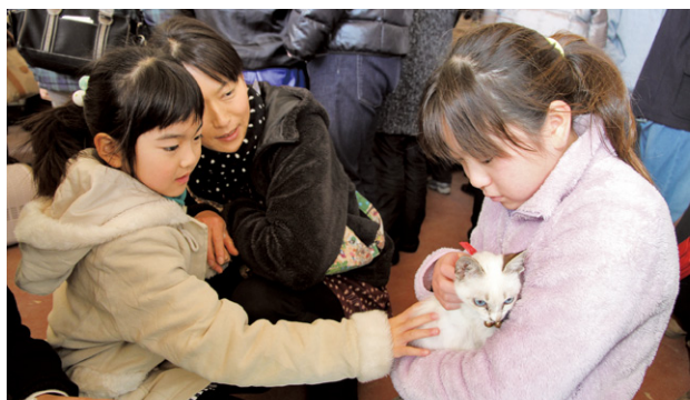
▲昨年の犬・猫譲渡会の様子