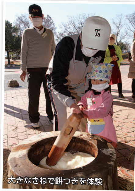
大きなきねで餅つきを体験