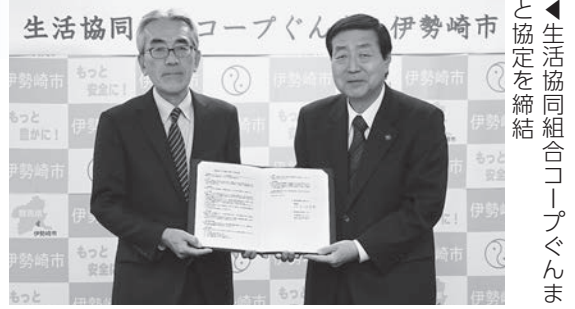
生活協同組合コープぐんま と協定を締結

ひとり暮らしの高齢者の孤独死などの痛ましい事態の発生を防ぐため、生活協同組合コープぐんまと地域見守り活動に関する協定を締結しました。コープぐんまが食品などを配達する際に、在宅高齢者の安否を確認します。 今後も住み慣れた地域で安心して生活することができる地域づくりの推進と、地域福祉の向上をより一層図っていきます。 問い合わせ 高齢政策課(☎27-2752)