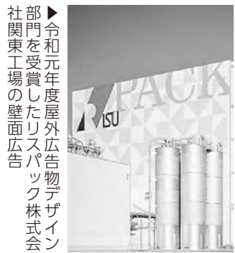
▲令和元年度屋外広告物デザイン部門を受賞したリスパック株式会 社関東工場の壁面広告