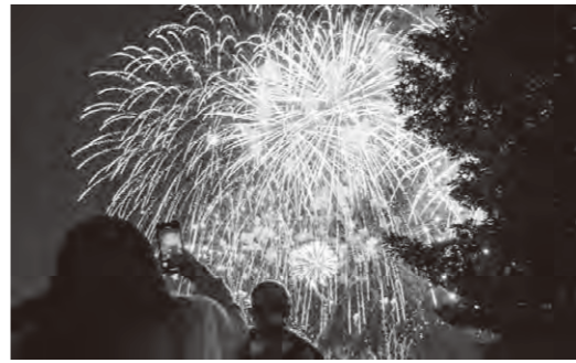
▲夏の夜空を花火が彩ります

期日 8月20日(土) ※荒天により順延の場合は8月21日(日) 時間 午後7時～8時 観覧会場 西部公園・つなとりスポーツ広場・オートレース場ほか ※ことはラブリバー親水公園全域において観覧ができません ※コミュニティバス「あおぞら」は運休となる便がありますので注意してください