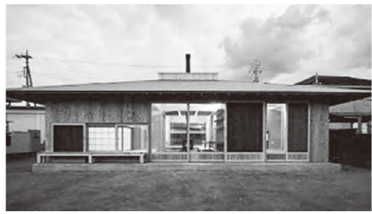
▲令和元年度建築物デザイン部門を受賞した「さかいまちのいえ」