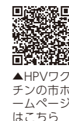
▲HPVワクチンの市ホームページはこちら

原則として同じ種類のワクチンを接種することをお勧めしますが、医師と相談の上、途中から9価のHPVワクチンに変更し、残りの接種を完了することもできます。