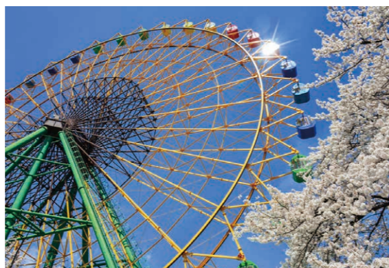
▲ネーミングライツ事業によって愛称が決まったAuto Mirai華蔵寺遊園地(華蔵寺公園遊園地)