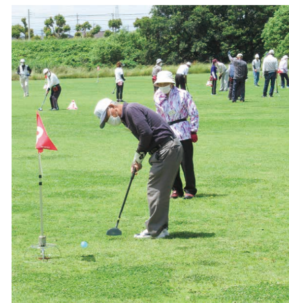
▲高齢者が生き生きと活躍できる社会の実現