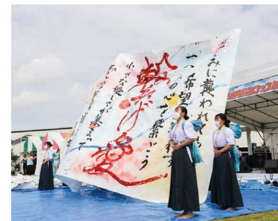
▲伊勢崎駅前のにぎわいを創出するイベントを実施