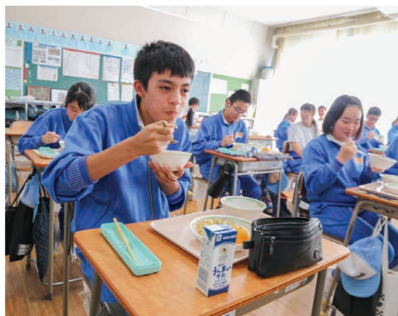
▲栄養バランスの取れた学校給食を安定的に提供