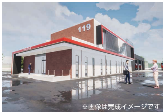
※画像は完成イメージです ▲境地区における災害応急対策の活動拠点として境消防署が新庁舎へ移転