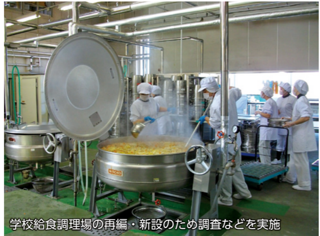
学校給食調理場の再編・新設のため調査などを実施