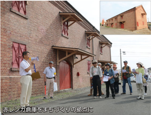
赤レンガ倉庫をまちづくりの拠点に