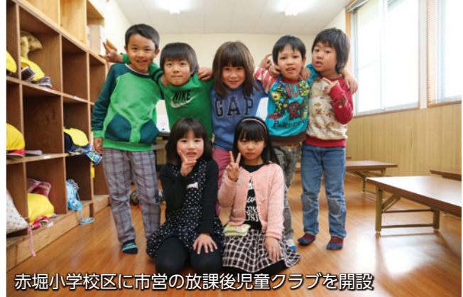
赤堀小学校区に市営の放課後児童クラブを開設