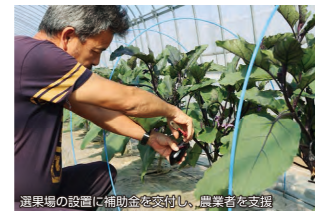
選果場の設置に補助金を交付し、農業者を支援