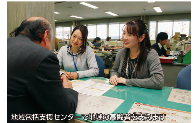
地域包括支援センターで地域の高齢者を支えます