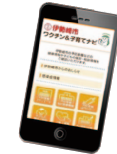
◀アプリにすることで、スマートフォンやタブレット端末で、より便利にワクチン&子育てナビを利用できるようになります