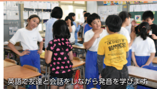
英語で友達と会話をしながら発音を学びます

★全小学校の英語教育に、発音と文字の関連性を学ぶ音声学習法「フォニックス」を導入 ..... 660万円