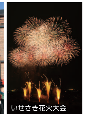
いせさき花火大会