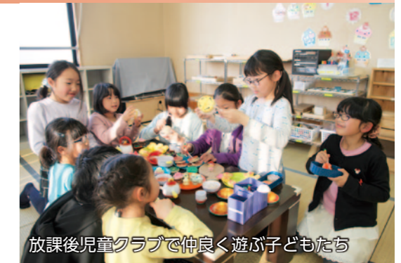
放課後児童クラブで仲良く遊ぶ子どもたち

★放課後児童クラブの支援員への処遇改善にかかる費用を助成 ..... 4,439万円