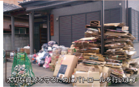
大切な資源を守るためにパトロールを行います

★資源物の持ち去り行為対策として、パトロール調査などを実施 ..... 700万円