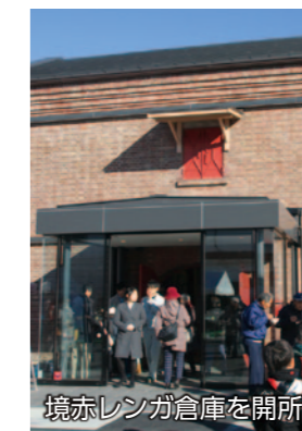
境赤レンガ倉庫を開所