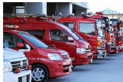
関連するSDG sのゴール

安心できるまちづくりや空き家対策の推進等、地域防災体制の充実や防犯体制を強化し、安心安全な暮らしの実現に取り組むとともに、快適で安全な住環境の保全を図る事業。