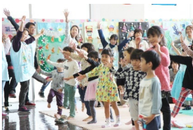
関連するSDG sのゴール

母子保健サービスの充実や子育て支援の充実等、安心して子どもを生育てられる環境の整備を図り、転出の抑制と出生数の増加に取り組むとともに、仕事と子育てが両立できる環境づくりを促進する事業。