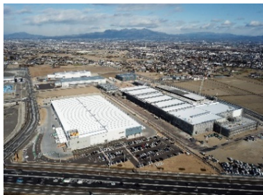
関連するSDG sのゴール

地域産業の活性化や付加価値の向上、就労への総合的支援、企業誘致の推進、農業の成長産業化等、魅力ある多様な就業機会を創出し、誰もが働きやすい環境を整備することにより、継続的に安定した雇用機会を創出する事業。