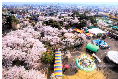
関連するSDG sのゴール

地域資源や観光資源を生かした誘客、関係人口の創出・拡大、地方居住の推進等、魅力ある観光づくりやスポーツイベントの充実を推進し、交流人口や関係人口の拡大に努めるとともに、UIターン等の推進や本市にある大学に通う学生に対する本市内への就職を促進するなど、転入者の増加を図る事業。