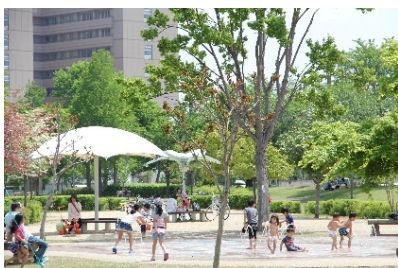
関連するSDG sのゴール

地域医療体制の充実、住み慣れた地域で安心して自立した生活を送ることができる体制の整備、魅力ある居住環境の整備、交通体系の確立等、魅力ある都市環境を構築して定住の促進を図るとともに、時代にあった持続可能なまちづくりを推進する事業。