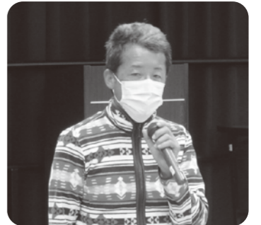
第18回市民ボランティアフェスティバル

開催できることをとても嬉しく思います。久しぶりの開催なので、来場者のみなさまだけでなく、参加団体のみなさまも大いに楽しめるようなフェスティバルになることを願っています。