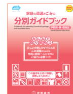
Phiên bản dành cho Iseaki Azuma-Khu vực Sakai

Bản hướng dẫn phân chia rác và rác tài nguyên