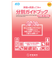
Phiên bản dành cho Isesaki-Azuma-Khu vực Sakai

Bản hướng dẫn phân chia rác và rác tài nguyên