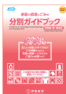
Phiên bản dành cho Iseaki-Azuma-Khu vực Sakai

Bản hướng dẫn phân chia rác và rác tái nguyên