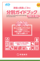
Edição: Zona de Iseaki, Azuma, Sakai

Guia de separação de lixos e materiais recicláveis