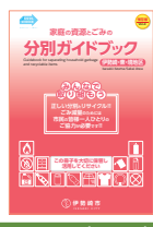
Edição: Zona de Iseaki, Azuma, Sakai

Guia de separação de lixos e materiais recicláveis