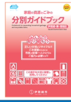
Versión de Isesaki, Azuma y Sakai